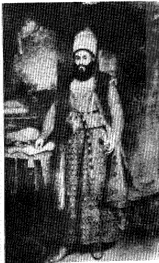
ابوالحسن خان شیرازی

مفهوم نوین آزادی با فرایند تأثیر غرب بر فرهنگ و تاریخ ایران همراه است. با در نظر گرفتن این واقعیت که تکاپوی کمیانی هند شرقی بریتانیا (از سال ۱۶۰۰م) با مهاجرت جمعی نویسندگان و شاعران ایرانی به هند همزمان گشت و گذشته از آن آگاهیهای آورده شده به هند توسط جهانگردانی چون اعتصام‌الدین که عقیده‌اش را درباره اروپا در سال ۱۷۶۷م ابراز داشت، این نظر منطقی می‌نماید که مهاجران ایرانی نخستین کسانی بودند که در معرض اندیشه‌های نو اروپایی قرار گرفتند. هرچند به نظر می‌آید که نمی‌توان نفوذ شایان نگرشی از غرب در نوشته‌های نویسندگان ایرانی سده هفدهم میلادی مشاهده نمود. اما در هر حال