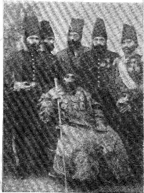
میرزا اسید جعفرخان مشیرالدوله با دیپلماتهای ایرانی در لندن

نوشتند. هرچند پاره‌ای تفاوتها ممکن است میان نوشته‌هایشان مشاهده شود، به نظر می‌رسد که میرزا ابوطالب اصفهانی به دیده انتقادی به برخی از جنبه‌های نظام بریتانیایی نگریسته است، مثلاً وی آزادی مطبوعات را تا اندازه‌ای زیانبار دانست و از عضویت در فراماسونری خودداری نمود. ۲ برعکس میرزا صالح با تحسین، انگلستان