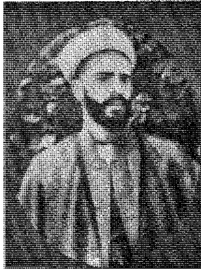
نسخ محمد خیابانی

مداخلات بیگانه وابسته نباشد. همچنین در خلال همین دوران است که گروهی از روشنگران اصلاح‌طلب به رهبری احمد دانش (فوت ۱۸۹۷م) در بخارا پیدا شدند. مهمترین اثر سیاسی و فلسفی احمد دانش به نام «نوادالوقایع» نوشته در ۱۸۷۵ تا ۸۲ میلادی است که در آن به لزوم اصلاحات اجتماعی و آزادی مردم از قید حکومت ستمگرانه امیربخارا در آن روزگار اختصاص دارد. هواداران او مانند شاهین، سودا، اسیری، عینی و شماری دیگر راه او را پی گرفتند. ۳۳ پس از آن دوران ما شاهد اشعار انقلابی مانند «سرود آزادی» سروده عینی و «به شرف انقلاب بخارا» سروده عکاسباشی هستیم. ۳۴ این دوران همچنین همزمان با اقدامات نوگرایانه در افغانستان است. به دلیل رقابتهای انگلستان و روسیه در سراسر سده نوزدهم میلادی، آزادی سیاسی از دیدگاه افغانها، بنابر آنچه که تعدادی از روزنامه‌های با عمر کوتاه، مانند «کابل» (۱۸۶۷م)، «شمس‌النهار» (۱۸۷۵م) مطرح کردند، به معنای استقلال کشورشان از دست‌اندازهای بیگانه بود. نگرش افغانها درباره اندیشه آزادی در نخستین روزنامه مهم هفتگی‌شان به نام «سراج‌الاکابر الافغانیه» (۱۹۱۱م) که مسائل نوگرایی و استقلال ملی در آن به گسترده‌گی و در سطح بالایی مورد بحث قرار می‌گرفت نمایان شد. محمود طرزی سردبیر روزنامه بیان می‌داشت که توسعه و پیشرفت ملی حقیقی تنها هنگامی ممکن است که جامعه از استقلال، قدرت و آزادی کامل برخوردار