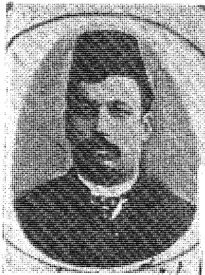
میرزا آقاخان کرمانی

● مفهوم نوین آزادی با فرایند تأثیر غرب بر فرهنگ و تاریخ ایران همراه است.