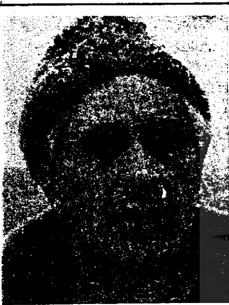
سید ضیاءالدین طباطبایی

ورود پیش قراولان نیروهای تحت امر احمد آقاخان به شاه آباد. آخرین ملاقات رضا خان، کلنل کاظم خان، مازور مسعودخان، احمد آقاخان و