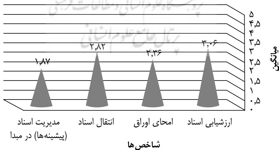
نمودار ۴-۲؛ سنجش شاخص‌ها در فرایند شناسائی و فراهم‌آوری اسناد

باتوجه به جدول ۴-۲، می‌توان مشاهده کرد که