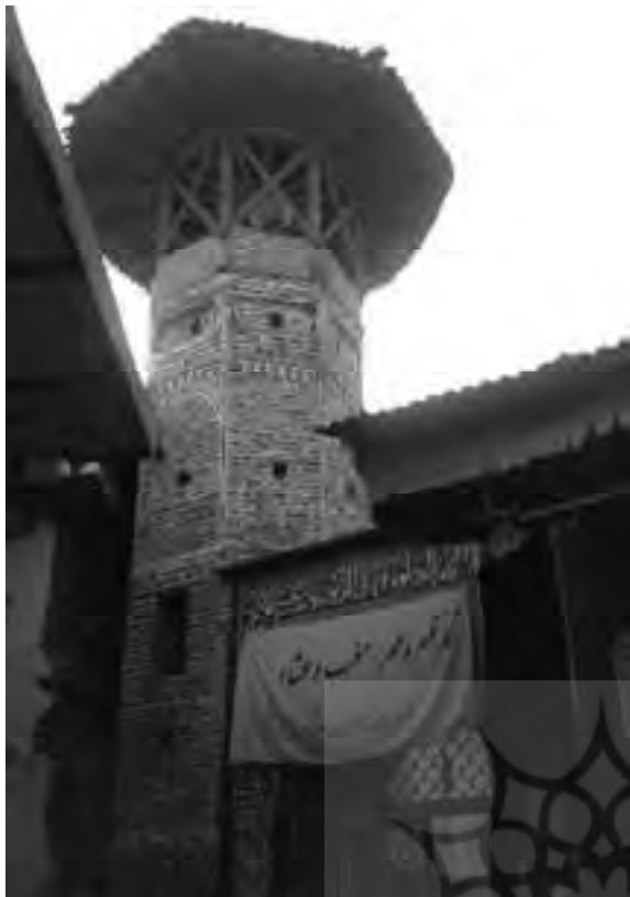
ورودی مسجد و مدرسه آقاعباس

در شرق کاردرگر محله، غرب بازار و تکیه مشائی واقع شده است. در سمت چپ در ورودی، مأذنه‌ای هشت ضلعی از آجر قرار دارد (ستوده، ۱۳۶۶، ج ۴، ب ۱، ص ۷۰). مهجوری، در تاریخ مازندران از این مسجد به صورت مسجد و مدرسه آقاعباس یاد کرده است. (مهجوری، ۱۳۴۵، ص ۲۴۸)