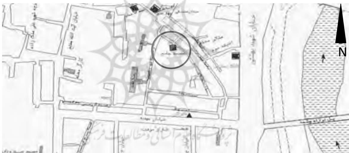
موقعیت مسجد و مدرسه جامع آمل

دانسته و به هارون الرشید نسبت داده‌اند. سید ظهیرالدین مرعشی گفته: در سال ۸۸۱ق. کسانی از نسل عثمان بن نهیک (بانی مسجد)، از لار قصران برای تعمیر آن آمدند. بخش غربی مسجد، بر اثر زلزله خراب شد و در سال ۱۲۲۵ق. آن را آقا علی اشرف مشائی و حاجی گرشاسب تعمیر کردند. در عهد فتحعلی شاه قاجار، در ۱۲۲۵ق./ ۱۸۱۰م. مرمت گردید. (رایینو، ۱۳۶۵، ص ۷۲) این مسجد در ۱۳۲۸ش. بیست باب حجره طلبه‌نشین