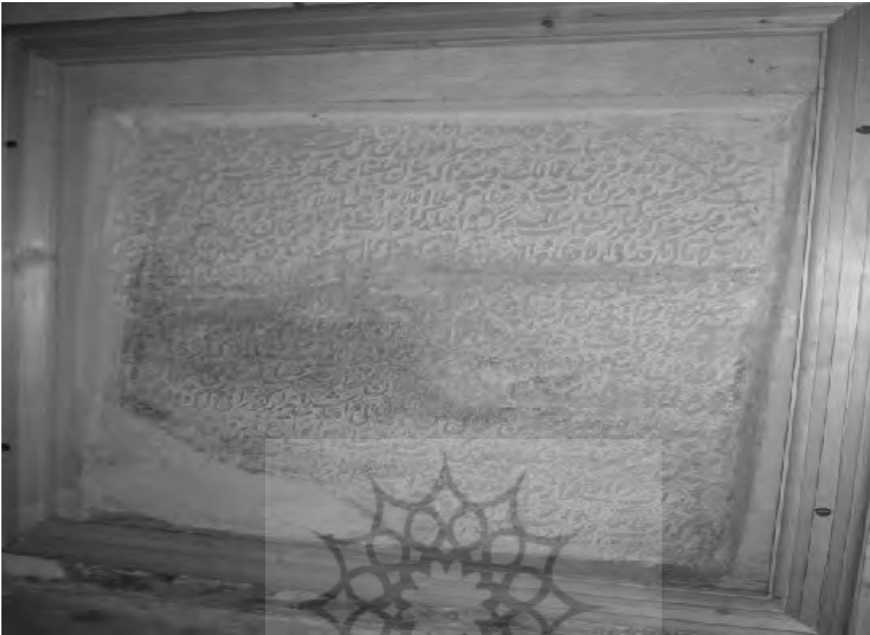
کتیبه نصب شده بر سر در ورودی مسجد و مدرسه جامع آمل

چیده و کعبتین عاج نیرین جهت تحصیل نقد سعادت کونین به نقش شش جهت گردیده، گنجور گنجینه وجود به مؤدای حقانیت اقتضای «قل اللهم مالک الملک تؤتی الملک من تشاء و تنزع الملک ممن تشاء و تعز من تشاء و تذلل من تشاء بیدک الخیر انک علی کل شیء قدیر»، درهم و دینار تمام عیار دولت و اعتبار و زردهی پادشاهی و فرماندهی عرصه روزگار را جهت این دودمان خلافت و امامت و خاندان نبوت و ولایت در مخزن هستی، در کمال تردستی محفوظ و مضبوط داشته، جهت سپاس این عارفه بی قیاس و ادای شکر این عطیه محکم اساس، درین عهد سعادت مهد - که عذرای دولت روزافزون در آغوش و لیلای سلطنت ابد مقرون دوش بدوش و اولین سال جلوس میمنت مانوس و اوان شکفتگی گلشن آمال عامه نفوس است - همت صافی طویت معدلت گستر و