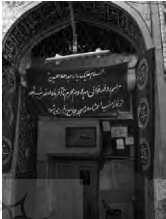
ورودی مسجد و مدرسه جامع آمل

مسجد و مدرسه آقاعباس، مربوط به ۱۱۴۴ق. / ۱۷۳۱م،