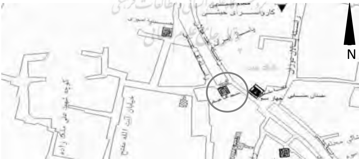
موقعیت مسجد و مدرسه آقاعباس

در واقع مسجد جامع آمل، دارای دو مسجد بزرگ و کوچک و ۲۰ حجره برای طلاب بوده است. (علامه،