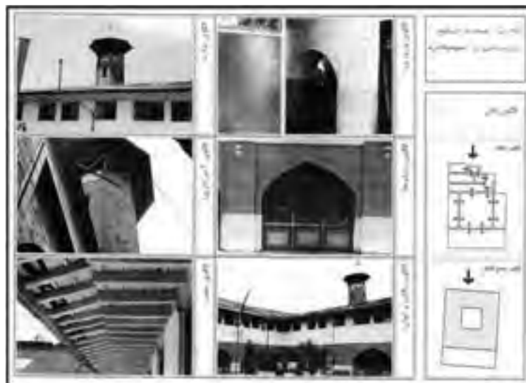
الگو و نمای مسجد جامع آمل