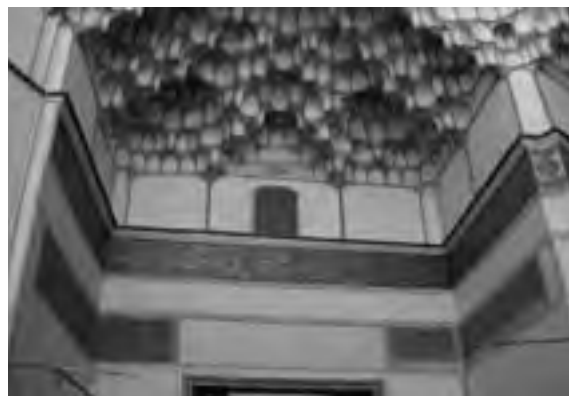
تصویر ۳- سردر مسجد میرعماد کاشان و تعدادی از کتیبه‌های فرمان‌های قراقیونلو تا صفوی

بر سردر مسجد جامع دماوند - که در میان محله قاضی و محله چریک واقع شده است ۲۱ - علاوه بر سنگی که صورت تاریخ طاعونی را به سال ۱۲۴۷ق. / ۱۸۳۲م. ثبت کرده، فرمانی از شاه عباس اول با همان تاریخ فرمان مسجد جامع اردستان یعنی ۱۰۲۴ق. / ۱۶۱۵م. نصب گردیده که موضوع آن نیز اعطای تخفیف مالیاتی به شیعیان دماوند، خوار و