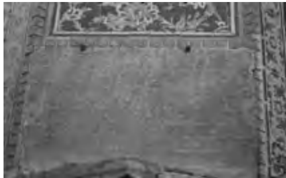
تصویر ۲- فرمان شاه عباس بر جرز شرقی ایوان جنوبی مسجد شاه اصفهان

بنیچه ۱۰ جمع هر محل وضع نمایند و [...] به رعایا نرسانیده، قلم و قدم کشیده و کوتاه دارند. سادات عظام و علمای گرام و قضات اسلام و اهالی و اعیان و ارباب و رؤسا و کدخدایان و اهل حرفت و عموم رعایای دارالسلطنه، از بلده و بلوکات، بدین عطیه ۱۱ عظاما، مبتهج ۱۱ و مسرور بوده، از روی امیدواری تمام، در لوازم دعاگوئی و دوام دولت ابد پیوند. ۱۲ (تصاویر ۱ و ۲)