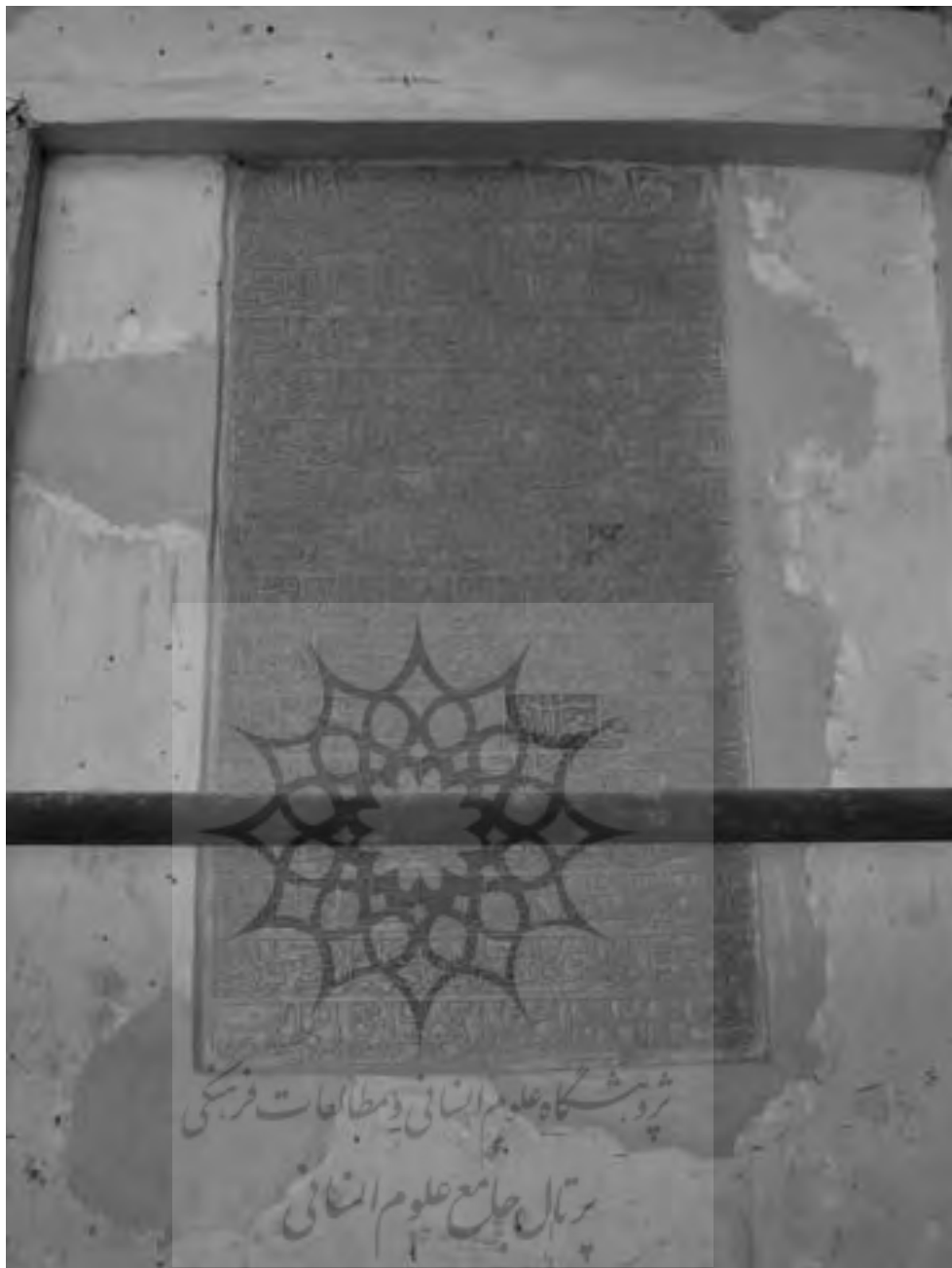
تصویر ۵- فرمان شاه عباس در مسجد جامع اردستان

شد و در آخرت در خدمت حضرت امیرالمؤمنین و امام المتقین - علیه السلام - شرمندہ خواهند بود و تغییرکننده تخفیف مذکور، به لعنت الهی و نفرین حضرت رسالت پناهی گرفتار گردد و باید که دستور دوام الشرف را بر سنگ نقش نموده، بر در مسجد جامع نصب نمایند و در دعاگوئی دوام دولت قاهره، تقصیر نکنند. فی شهر شعبان سنه اربع