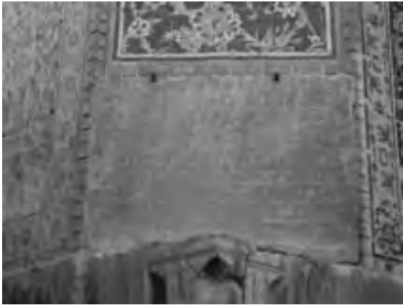
تصویر ۱- موقعیت فرمان شاه عباس بر جرز شرقی ایوان جنوبی مسجد شاه اصفهان

مطالبات دیوانیه سبکبار بوده و در مهد امن و امان آسوده فارغ البال ملهم توفیق ازلی و [...] به خاطر فیض مآثر پرتو انداخت که در ماه رمضان که ایام طاعات و عبادات است و شیعیان اهل بیت طیبین و طاهرین که سالکان مسالک حق و یقین [...] و ادای صوم و صلوات و وظائف طاعات و عبادات، قیام و اقدام نمایند که هر آینه ثوابت ۶ آن، به روزگار فرخنده آثار همایون ما عاید گردد. لهذا شمه [ای] از مراحم و الطاف [...] شیعیان ممالک محروسه فرموده، در کل قلمرو همایون، مالوجهات [...] رمضان المبارک - سوای جهاتی که به اجاره می دهند - تخفیف و تصدق مقرر فرموده، ارزانی داشتیم و این حکم همایونی، از مکمن ۷ [...] دارالسلطنه اصفهان - که مردم آنجا ابا عن جد از زمره شیعیان اند و حلقه اخلاص و بندگی این دودمان ولایت نشان بر گوش جان دارند - عز اصدار یافته، مستوفیان عظام دیوان [...] و ثبت نموده، از شوائب ۸ تغییر و تبدیل مصون و محروس دارند. وزرا و عمال و متصدیان مهمات دیوانی دارالسلطنه مذکوره، از ابتدای توشقان نیل، مالوجهات و وجوهات [...] به تخفیف و تصدق مقرر دانسته، در آن ماه مبارک - که ایام و لیالی متبرکه است - به علت حقوق دیوانی حواله و اطلاقی بر رعایا و عجزه ننموده، از حشو ۹