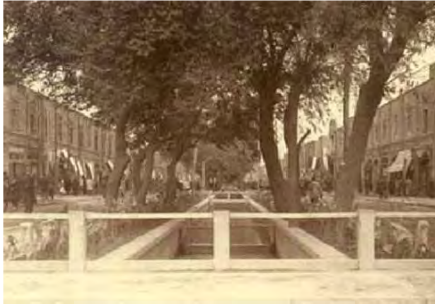
تصویر ۳: خیابان (چهارباغ) شهر مشهد- تصاویر تاریخی شهر مشهد

۵-۶- استفاده از عناصر تقویت کننده سیمای (ویژگیهای ذهنی) راه.