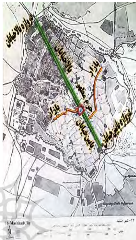
نقشه ۱: شهر مشهد در سال ۱۸۵۸م، نقشه برداری شده توسط نقشه بردار ژارنیف

تاریخ دقیق سفر شاه عباس که منجر به احداث خیابان (چهارباغ) شهر مشهد شده، اندکی مغشوش است. چنانکه در بالا اشاره گردید، در تاریخ عباسی (روزنامه ملاجلال)، تاریخ این سفر شاه عباس در سال ۱۰۱۶هـ ق عنوان شده است، درحالی که اسکندر بیگ منشی سفر شاه در سال ۱۰۱۶هـ ق را