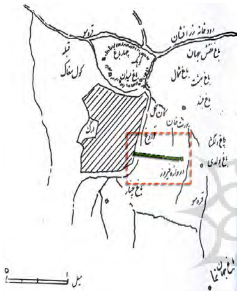
نقشه ۲: شهر سمرقند و خیابان قوروغ در قرن پانزدهم

بوده‌اند و از فیروز یا «دروازه فیروزی» شهر سمرقند به باغ دلگشا منتهی می‌گردیده است (نقشه ۲). «باغ دلگشا تا دروازه فیروز خیابان کرده در هر دو طرف دو چوب تزک ایستاده کرده» (بابر، ۱۳۰۸هـ ق: ۳۰). دونالد ویلبر این طرح و روش [در خیابان سازی] را مشابه آنچه در اصفهان (منظور خیابان چهارباغ است) در قرن هفدهم میلادی اتفاق افتاده می‌داند ۴ (ویلبر، ۱۳۸۵: ۶۰).