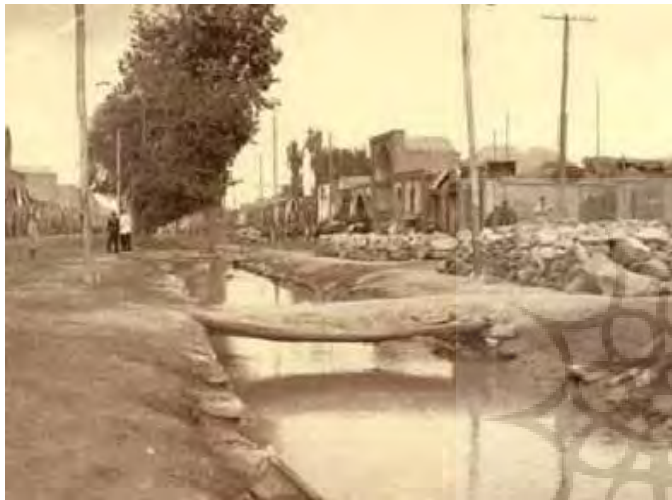
تصویر ۲: خیابان (چهارباغ) شهر مشهد - تصاویر تاریخی شهر مشهد ( http://www.panoramio.com/photo/5443421 )

عریضی که در وسط خیابان قرار دارد (تصویر ۲) و ماریچ گونه ۲ از میان شهر می‌گذرد، منظره‌ای به غایت دلپذیر به شهر بخشیده است. در دو سوی این نهر، به فاصله‌های معین درختانی کاشته‌اند که مردم در زیر سایه آنها می‌آرمند؛ و در واقع، این ممیزه است که مشهد را یکی از دلرباترین شهرهای ایران می‌کند» (Vambery, 1973: 284-285)