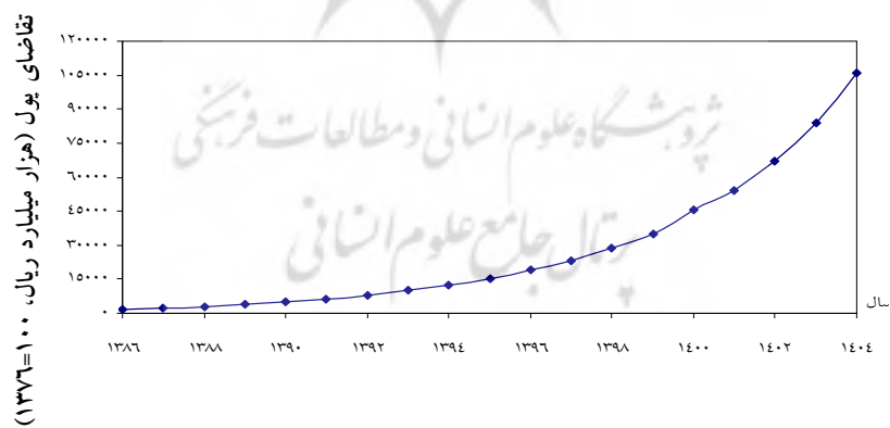
نمودار ۳. روند پیش‌بینی تقاضای پول برای دوره زمانی ۱۳۸۶-۱۴۰۴