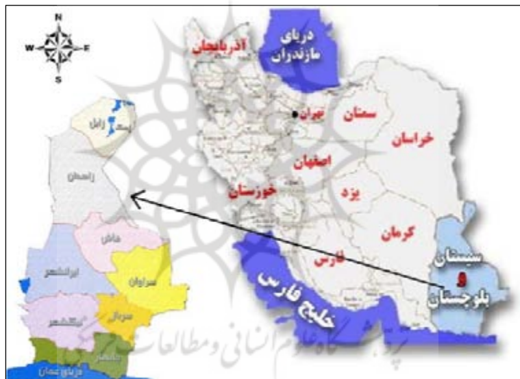
شکل ۱: موقعیت جغرافیایی شهرستان زاهدان

شهرستان زاهدان در ناحیه‌ی شمالی استان سیستان و بلوچستان در شمال قله‌ی تفتان بین ۵۹ درجه و ۵۰ دقیقه تا ۶۱ درجه و ۳۰ دقیقه طول شرقی و ۲۸ درجه و ۳۵ دقیقه تا ۳۰ درجه و ۲۵ دقیقه عرض شمالی واقع گردیده است (شکل ۱). شهرستان زاهدان با توجه به موقعیت جغرافیایی و قرارگیری در عرض‌های پایین و دور بودن از محدوده‌ی اثر جبهه‌های مدیترانه‌ای نسبت به سایر نقاط کشور از رطوبت کمتری برخوردار است و در نتیجه همواره با خطرات و عوارض ناشی از خشکسالی مواجه می‌باشد؛ به خصوص خشکسالی‌های پی‌درپی چند سال اخیر خسارات فراوانی را به محصولات زراعی و باغی منطقه وارد ساخته است.