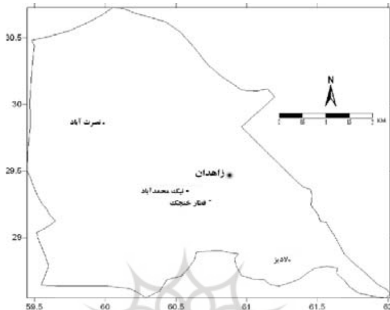
شکل ۲: پراکنش ایستگاه‌های مورد مطالعه در سطح شهرستان زاهدان