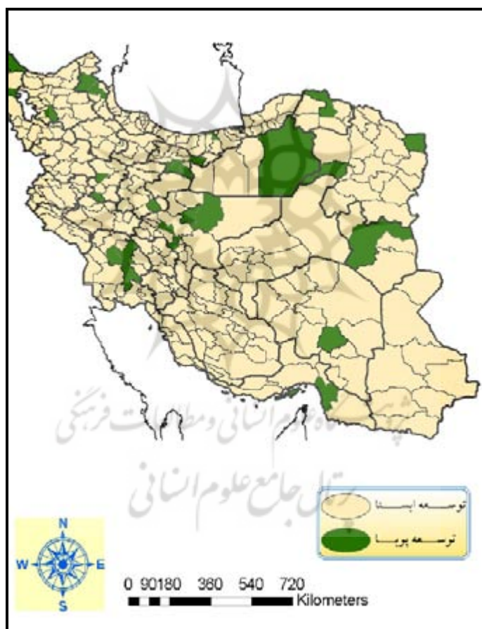
نقشه ۲: توزیع فضایی شهرستان‌های دارای رشد پویا و ایستا کشور طی دهه‌ی ۸۵-۱۳۷۵ بر اساس محاسبات نگارندگان، حاصل از مقایسه تطبیقی نسبت توسعه یافتگی شهری- منطقه‌ای کشور در سال‌های ۱۳۷۵-۱۳۸۵.