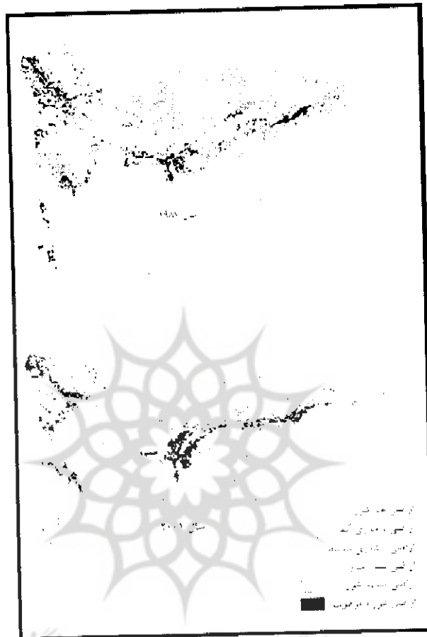
شکل ۲: نقشه‌ی طبقات مورد بررسی در تصاویر قدیم و جدید منطقه‌ی مورد پژوهش