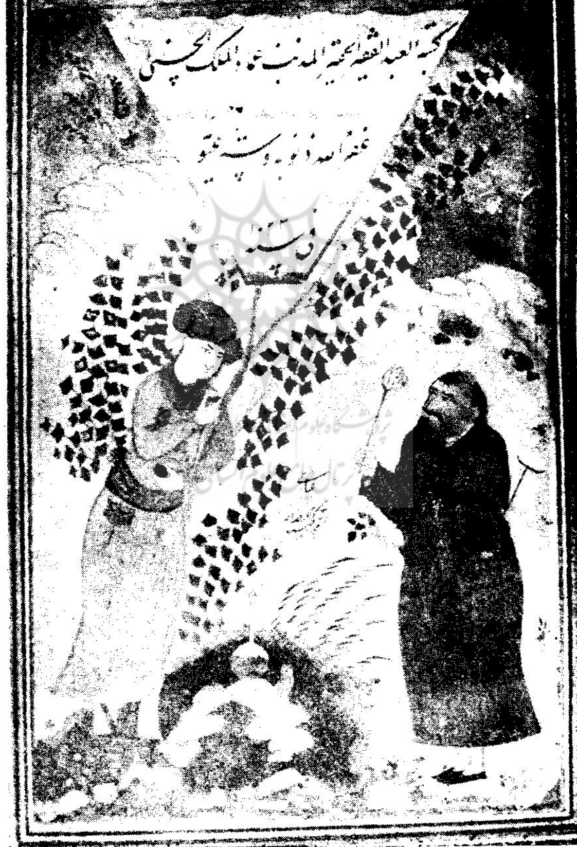
خط از میرعماد تصویر از رضای عباسی کاشی