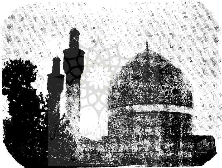
نمای گنبد مدرسه چهار باغ از مغرب

در انتهای غربی دیوار شمالی مدرسه حجره ای است که آنرا متعلق بشاه سلطان حسین میدانند و معروف است که در همین حجره بدست افغانه کشته شد - جلوی آن