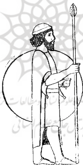
نمونه نقش برجسته آشوریان رو بروی دیوار پلکان شرقی کاخ آپادانا در تخت جمشید

یکی از وسایل شناسائی ملتهای موضوع این حجاریها نقش افراد ملتهای تابعه ایران بر بالای دخمه منسوب به اردشیر سوم در