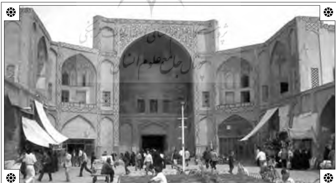
بازار اصفهان، بنای دوره صفوی

از سوی دیگر با اینکه محتوای این اثر درباره ایران بود حتی - تا آنجا که من اطلاع دارم - معرفی ساده‌ای از آن در ایران صورت نپذیرفت و البته متأسفانه دیدگاه، روش و نتایج تحقیق آن نیز از سوی پژوهشگران