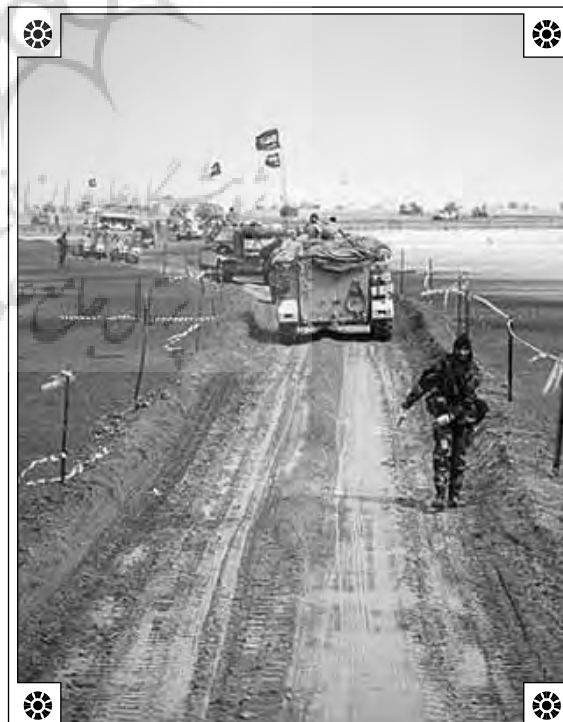
نیروهای نظامی عربستان در کویت، ۱۹۹۱، جنگ دوم خلیج

شاه شد. در این دوره ملی‌گرایی ایرانی دوره پهلوی کم ارزش شد و همچنین حمایت از موضوع امت اسلامی و برادری اسلامی که توسط جمهوری اسلامی مطرح شد، توده‌های عرب را به فکر نفوذ سیاسی ایران سوق داد. با شکل‌گیری حکومت اسلامی رد حکومت پادشاهی در شیخ‌نشین‌های شورای همکاری خلیج فارس و عراق مطرح شد. از این نظر مواجهه بین نظر دولت ایران و آل سعود عمیق شد. در کنار ضدامپریالیسم گرای و ضدسلطنتی بودن ایران، ضدملی‌گرایی (در ارتباط با حکومت بعثی عراق) چالش محوری برای بقای اشکال فرهنگی در منطقه خلیج فارس بود. نویسنده در این قسمت همچنین به جنگ ایران و عراق اشاره دارد و معتقد است تجاوز به ایران صرفاً نمی‌تواند به عوامل