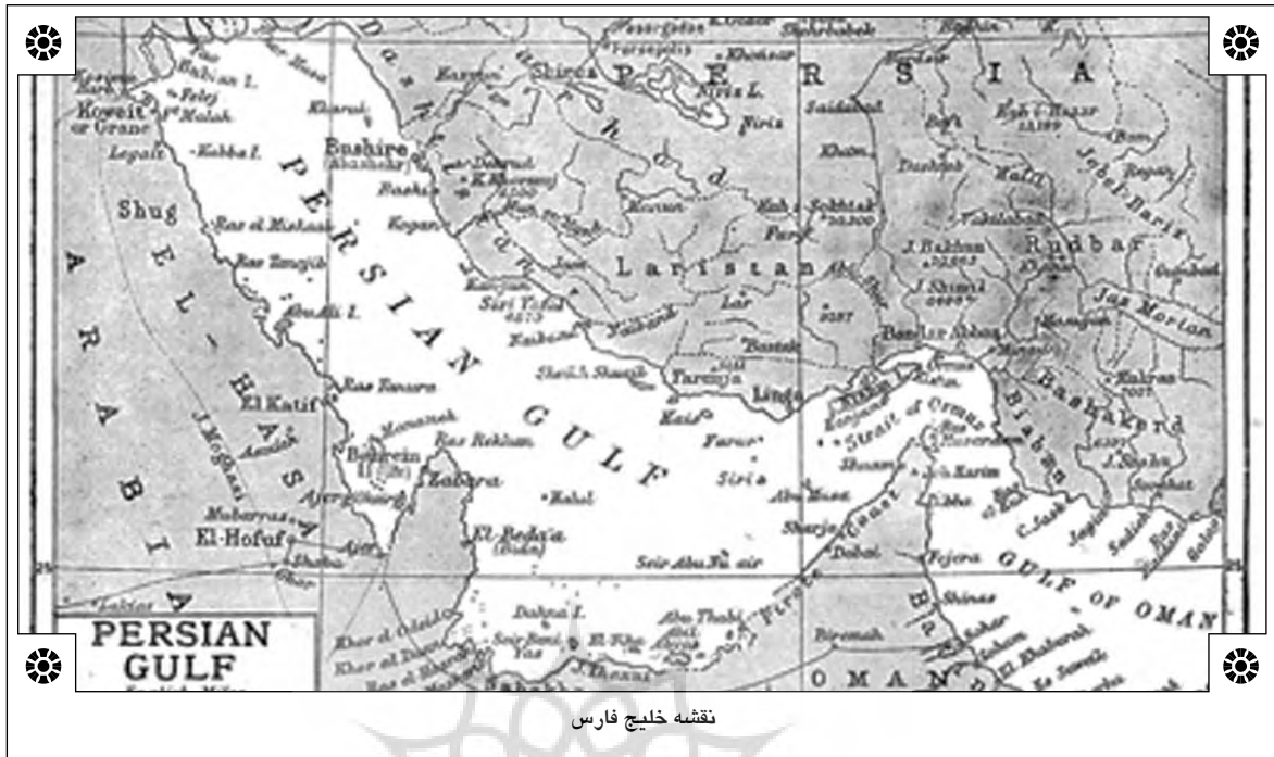
نقشه خلیج فارس

مفاهیم عمدتاً آلمانی و فرانسوی ملی‌گرایی به‌عنوان اندیشه غیر دینی و رخدادی امروزی در غرب آسیا افسانه‌ای پدید آورد که روابط اعراب و ایران همیشه ستیزه‌جویانه بماند و نتواند از فرصت تکمیل همکاری‌های امنیتی در طول دهه‌های قبل بهره‌مند شود اما علی‌رغم تقسیمات پدید آمده بر اساس روایت‌های خاص، هویت دولتی جامعه منطقه‌ای برای اعتدال بخشی به اندازه کافی قوی بود.