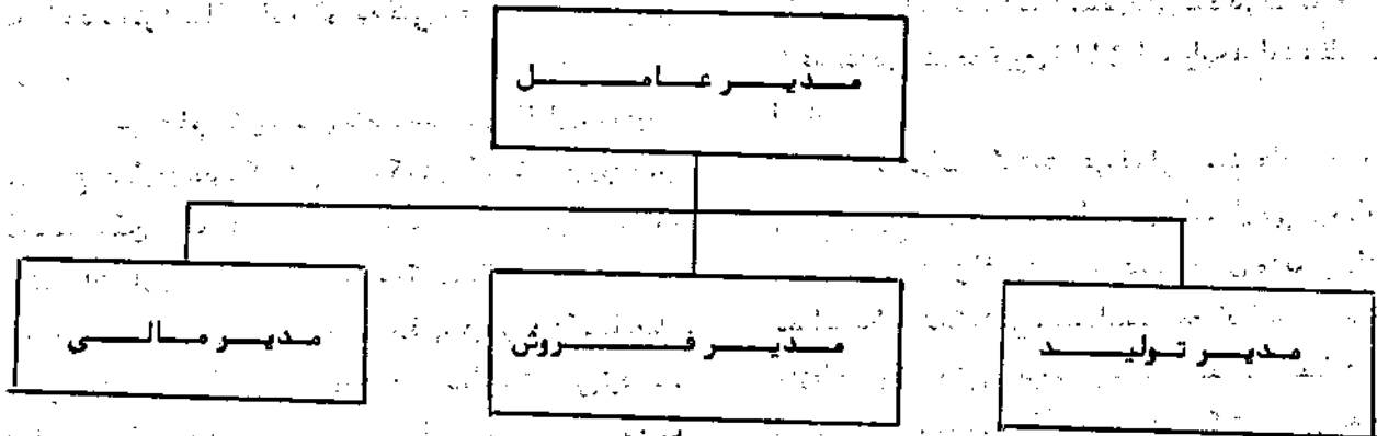
نمودار شماره (۱) - سازمان براساس تخصص

راکه براساس تخصص تنظیم شده تحت تأثیر قرار می دهد.