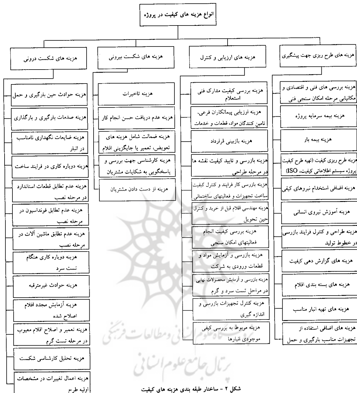
شکل ۲ - ساختار طبقه بندی هزینه های کیفیت