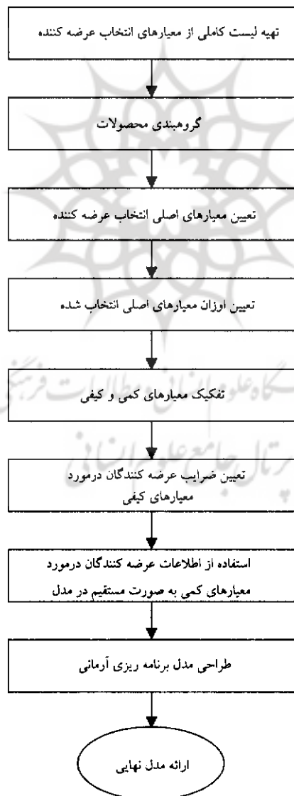
شکل ۳ - گامهای اصلی در طراحی مدل انتخاب عرضه کنندگان

گام اول، تهیه لیست کاملی از معیارهای انتخاب عرضه کننده: تعیین معیارهای انتخاب عرضه کننده شاید یکی از مهمترین مراحل در طراحی مدل باشد. به طوری که اگر در این مرحله، دقت لازم صورت نگرفته و معیارها به طور صحیح و همه جانبه انتخاب نشوند، چه بسا مدل نهایی قابلیت تبیین و پیش بینی لازم را نخواهد داشت و نتایج درستی ارائه نخواهد داد. لذا باید ابتدا لیست کاملی از معیارهای انتخاب عرضه کننده تهیه شود که