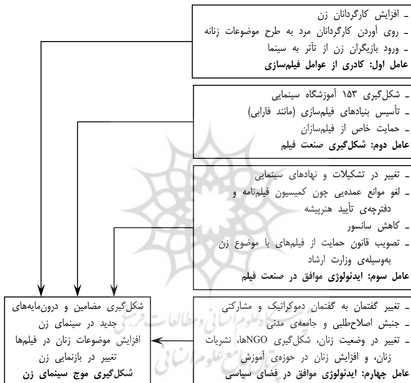
نمودار ۲- مدل عناصر اجتماعی مؤثر بر شکل‌گیری سینمای زن