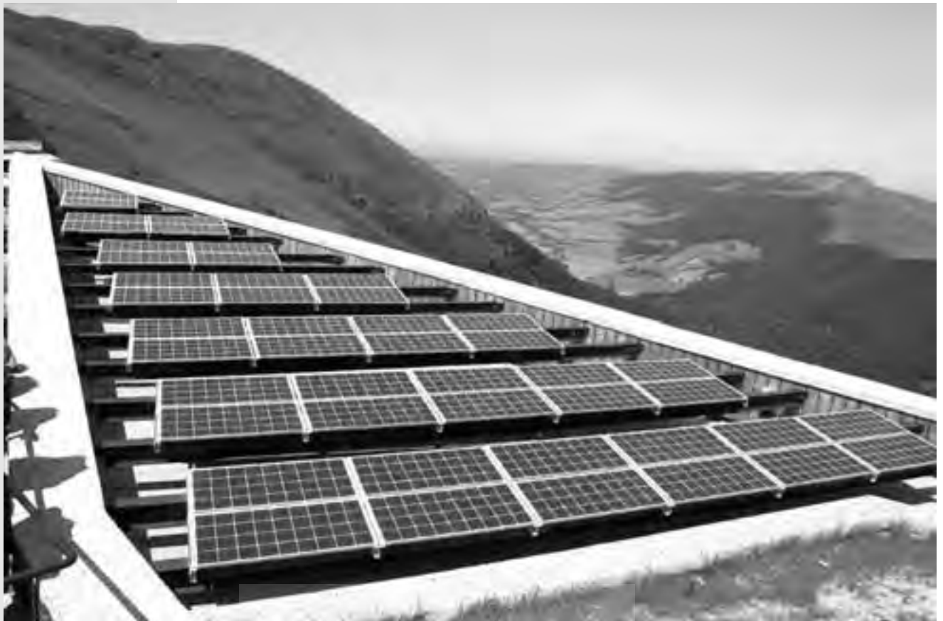
استفاده از انرژی خورشیدی، جایگزین مناسبی برای منابع هیدروکربوری است.

در کشور ما هنوز سطح جرایم وضع شده در ارتباط با آلودگی محیط زیست بسیار پایین است و مقامات مسوول هم در ایجاد مشوق‌های لازم برای تغییر رفتار صنایع آلوده‌کننده بسیار ضعیف عمل می‌کنند.