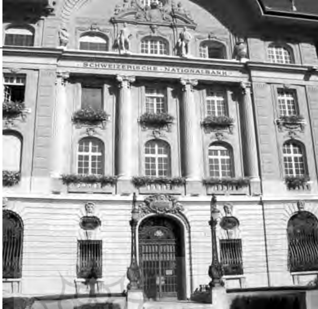
بانک مرکزی سوئیس از استقلال قانونی نسبی برخوردار است.