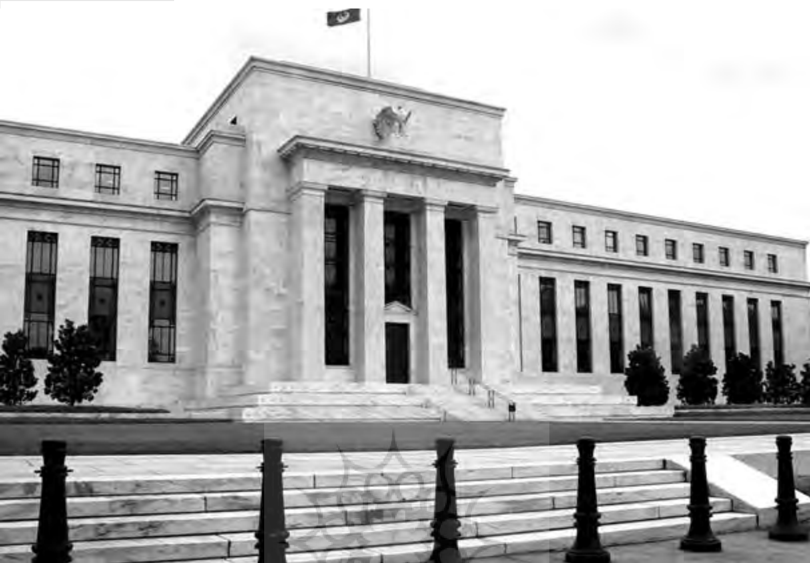
نمایی از فدرال رزرو آمریکا.

به‌شمار می‌رود که حتی بیش از بوندس بانک آلمان از فشارهای سیاسی برکنار مانده و سیاستگذاری اقتصادی، به مقامات غیر منتخب سپرده شده است. رویهمرفته، بانک‌های مرکزی جهان هیچ‌گاه در طول تاریخ کوتاه خویش از قدرت و احترام و منزلتی که امروز برخوردارند، برخوردار نبوده‌اند.