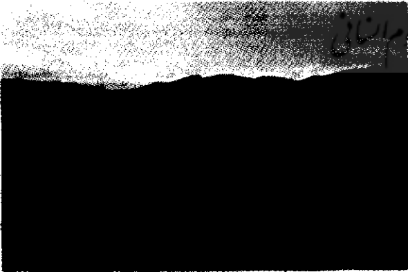
دورنمای روستای سرای در شرق دریاچه اورمیه (جزیره اسلامی)

روستای تیمورلو از دهستان شرفخانه، بخش شستر و شهرستان تبریز است در ۳۳ کیلومتری جنوب غربی بخش شستر و در جزیره اسلامی واقع شده است. ارتباط آن با آبادیهای اطراف از طریق بندر آق گنبد به فاصله ۱۴ کیلومتر انجام می گیرد. آب و هوای روستای تیمورلو معتدل دریایی است. جمعیت این روستا ۲۵۰ نفر بوده مذهب مردم آن شیعه، زبان ساکنان آن ترکی آذری است. آب کشاورزی روستا از چاه نیمه عمیق و چشمه تأمین می شود. محصول زراعی آن غلات، حبوبات بوده، شغل مردمش زراعت و گلهداری است. ارتباط این روستا با سایر آبادیهای جزیره به وسیله اتومبیل انجام می گیرد و ارتباط اش با سایر بنادر دریاچه به وسیله کشتی و قایق برقرار می شود.