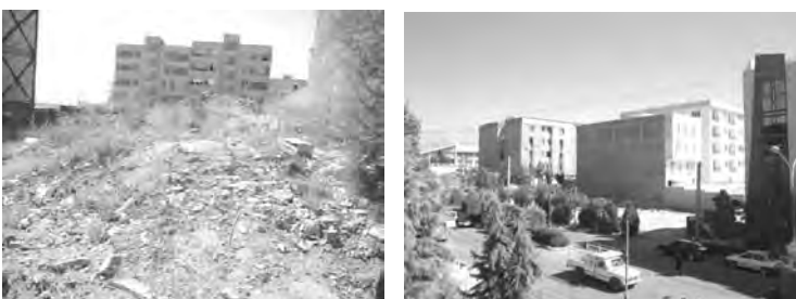
تصاویر ۱۱ الی ۱۴ - شهر جدید هشگرد.