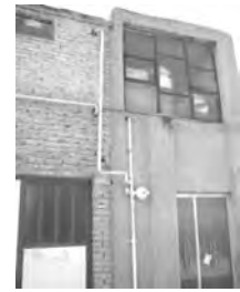
تصاویر ۱۵ الی ۱۸ - شهرک وردآورد .