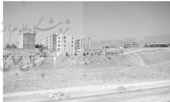
تصاویر ۱ و ۲ - رشد بی‌رویه بافت‌های مسکونی پیرامون تهران سبب از بین رفتن زمین‌های بکر و توسعه افقی دسترسی‌ها گشته است.