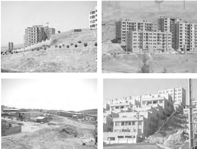
تصاویر ۷ الی ۱۰- شهر جدید پردیس .

شهر هشتگرد جدید در شمال شهر قدیمی هشتگرد واقع شده