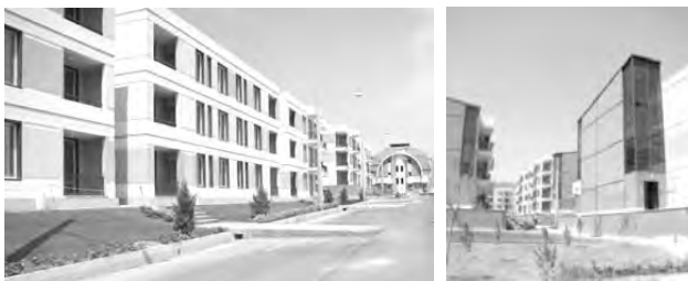
تصاویر ۳ الی ۶- شهر جدید پرند.

محیط‌زیست و استفاده بی‌رویه از انرژی و منابع طبیعی گشته است، توصیف و سپس تحلیل شده است.