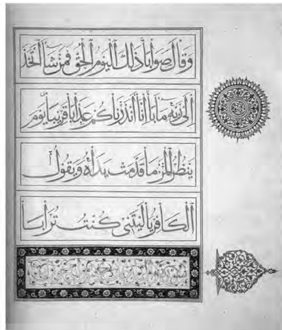
تصویر ۳- صفحه‌ای از قرآن، کتابت و تذهیب محمد همدانی، قرن ۸ هـ. ق، اعراب‌گذاری با رنگی متفاوت از متن است و خطوط با زر نوشته و با مرکب مشکی تحریر شده است. صفحه مجدول سرسوره کتیه مذهب مجدول همراه بادامچه نیزه دار، حاشیه صفحه دارای شمشه مذهب و علائم تجویدی وسط آن کتابت شده. (Raby, 1997, 119) ماخذ:

۱- ب- نقوش به کار رفته در صفحات افتتاحیه: در بیشتر قرآن‌های این دوره صفحات افتتاحیه به صورت تمام مذهب است و با انواع نقوش هندسی گیاهی و تزئینی پوشیده شده