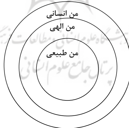
شکل ب: رابطه میان قلمروهای حیات با حاکمیت من انسانی