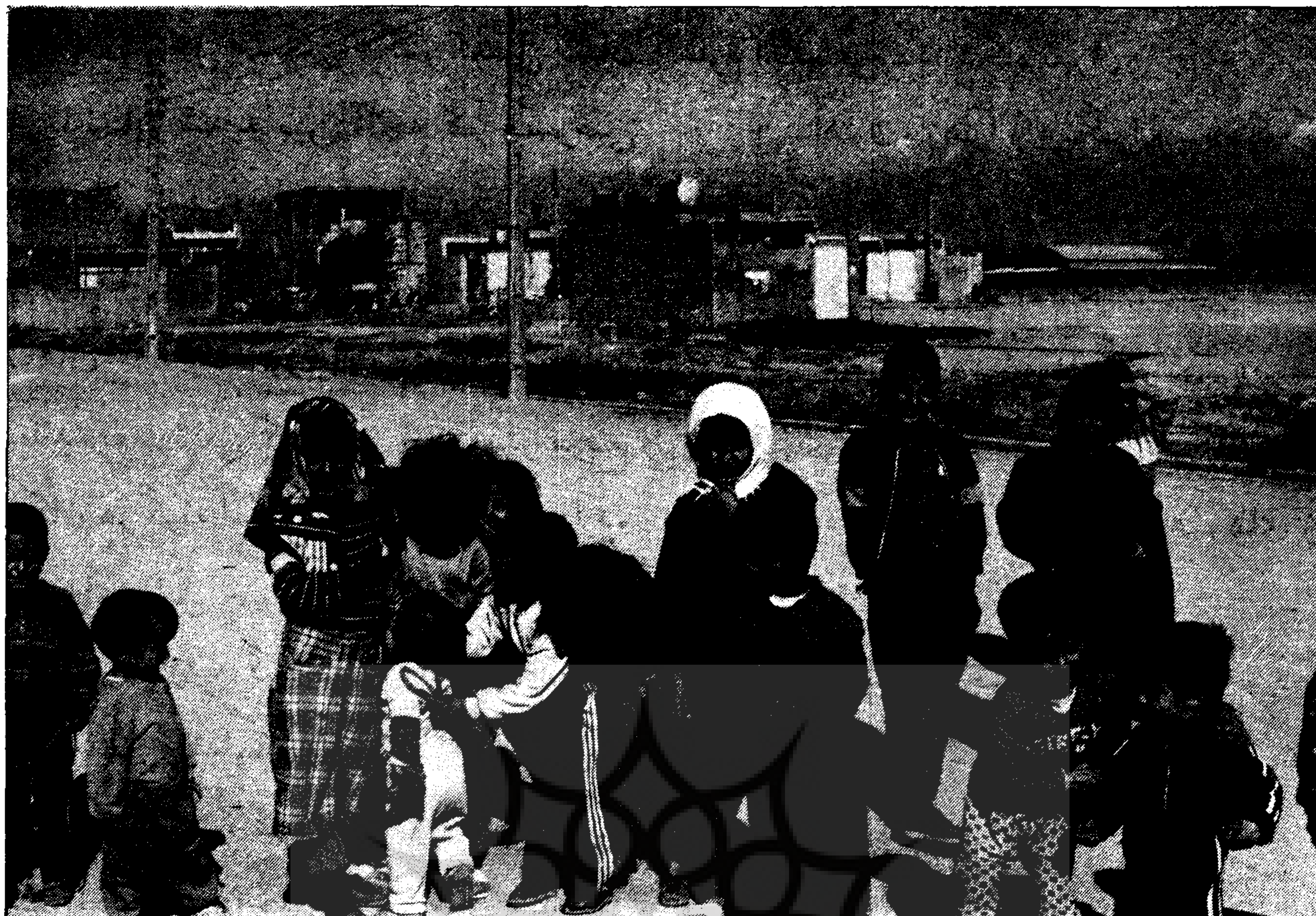
ازدحام در مسکن، خروج فرزندان از خانه و کاهش کنترل والدین بر آنها را سبب می‌شود.