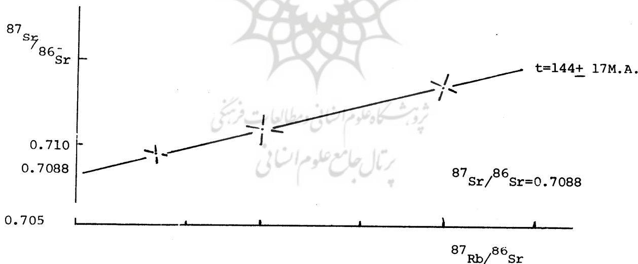
نمودار شماره ۱ - ایزوکرون سنگهای آلموقلاق

در پایان متذکر میگردیم نظری را که در اینجا عرضه کردیم نتیجه ای است که از بررسیهای مقدماتی که تاکنون انجام گرفت ، حاصل گردید و اعلام میداریم یک پروژه تحقیقاتی در دست اقدام در این خصوص داریم ، امید است با انجام آن نتیجه اش را نیز در وقت خود منتشر نموده و با اطلاع علاقمندان برسانیم .