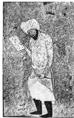
تصویر ۵- پرتره یک هنرمند موزه هنرهای زیبا، بوستون

پوششی برای قلمرو از یک سبک هنری به نظر آید و به نظر می‌آید " (راکسبره، ۲۰۰۰، ۶۵). چاره‌ای نداریم جز آنکه به امضای شخص هنرمند و نوشته‌هایی متوسل شویم که در حاشیه تصاویر گنجانده شده‌اند. اما باید توجه داشته باشیم که، ملاحظه نام هنرمند نیز به عنوان امضاء ممکن است سخن سنجیده‌ای نباشد. علی‌الخصوص که بسیاری از آثار مورد بحث فاقد یک امضای مشخص می‌باشد.