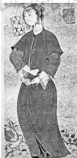
تصویر ۱۰- زنی با یک بادبزن گالری هنری فریر