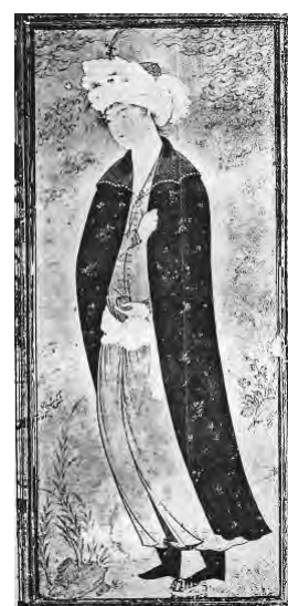
تصویر ۹- جوانی با عبا آبی موزه آرتور م. ساکسر، دانشگاه هاروارد، کمبریج