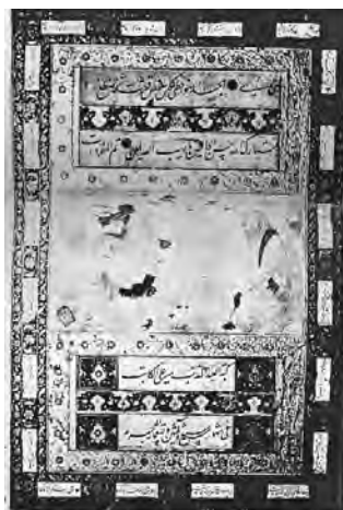
تصویر ۱۱- جوان و پیرمرد گالری آرتور م. ساکسر، موسسه اسمیتسونیان

وی که از شخصیت‌های استثنایی در تاریخ نقاشی ایران به‌شمار می‌رود، مشاهده عینی و ثبت حالات و حرکات واقعی و موضوع‌های مربوط به کار و زندگی آدم‌های عادی را اساس کار خود نهاد. اشخاص نگاره‌های او "به گونه‌ای زنده در حین انجام عملی خاص و معین و با حرکتی مؤثر" ارتباطی هماهنگ با طبیعت پیرامون یافته‌اند که آن نیز تأثیر بخش و پرتحرک تصویر شده است" (اشرفی، ۱۳۸۴، ۱۳۲). نوآوری او را زمینه‌ای برای شکل‌گیری مکتب اصفهان دانسته‌اند و شیوه کار او توسط