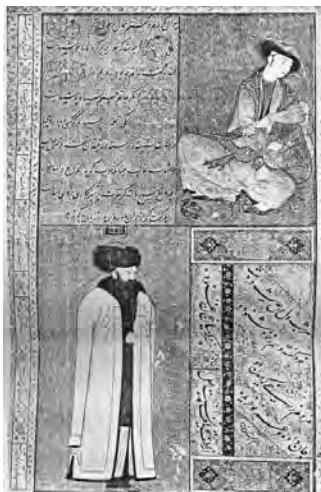
تصاویر ۸ و ۷- جوان لمیده روی یک بالش و پرتره یک سفیر روسی توپکایی استانبول