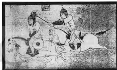
تصویر ۲- دوسوارکار موزه فاگ آرت، کمبریج

روی تمام این مهرها یک نوشته مشابه وجود دارد: "بنده شاه ولایت (خادم حضرت علی) شاه عباس"، اگرچه این جمله در القاب سلطنتی شاهان صفوی به وفور استفاده می‌شد، ولی بدیهی است که شاه عباس اول غالباً آن را به کار می‌برده است. این فرمول که آنتونی ولس ۸ آن را امضای استاندارد شاه بزرگ می‌نامد بر روی سکه‌های و شمشیر طلای شاه عباس اول نیز حک گردیده و می‌توان آن را بر روی مهرها و فرمان‌های وی نیز مشاهده کرد. ۹ توجه به نکات زیر در مطالعه آثار مهمور شده ضروری است: