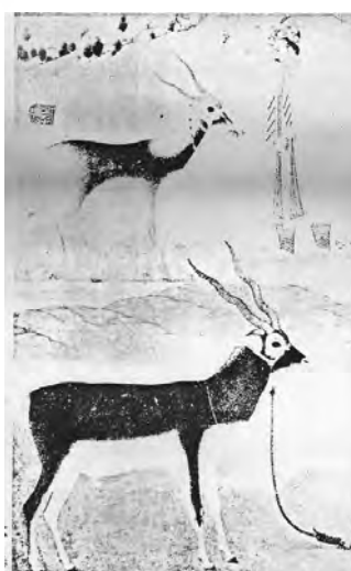
تصویر ۱۵- یک هندی نیازمند آهو کتابخانه کاخ گلستان تهران، مرقع گلشن