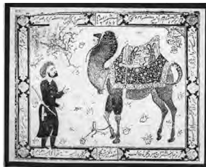
تصویر ۱- شتر و شتربان گالری هنر فریر، موسسه اسمیتسونین