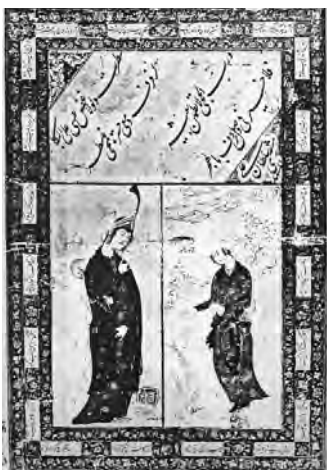
تصویر ۱۴- یک زن ایستاده گالری آرتور م. ساکس، موسسه اسمیتسونین