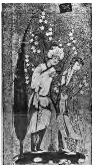
تصویر ۴- عشاق موزه هنرهای زیبا، بوستون

در این مجموعه بیست و دو نقاشی موجود است که روی ۱۸ ورقه به تصویر کشیده شده و تصویر مهر شاه عباس اول را بر روی آنها می‌توان دید، اما باید توجه داشت که اگرچه حضور این مهرها به تعیین زمان تقریبی این آثار کمک می‌کند، اما به تنهایی کافی نیست. چرا که، در برخی موارد زمان خلق اثر با تاریخ مهر منطبق نیست. به عنوان مثال: بازیل گری ۴ حدیقه الانس به تاریخ (۹۸۲ هـ.ق - ۱۵۷۳ م) را که در موزه هنرهای زیبای بوستون نگهداری می‌شود مربوط به دوران شاه طهماسب فقید می‌داند. ۵ در حالی که مهر شاه عباس اول را به خوبی می‌توان بر روی این اثر مشاهده کرد و با قضاوت از زمینه آن می‌توان برای آن تاریخ (۹۹۵ هـ.ق - ۱۵۸۶/۱۵۸۷ م) (تصویر ۶) را تعیین نمود. شایان ذکر است که، در آثار پژوهشگران متعدد حضور مهر عنوان شده ولی به روش‌های متفاوتی تفسیر گردیده است. مثلاً: ایوان سچوکین ۶ ، در توصیف نگاره "زنی با بادبزن" (تصویر ۱۰) با اشاره به تاریخ مهر اینگونه عنوان می‌کند که: "دقت داشته باشید سالی که این مهر به آن اشاره می‌کند، سال به سلطنت رسیدن شاه است و به پدید آمدن اثر ربطی ندارد و حتی می‌تواند پس از آن باشد. این اثر تعلق آن را به کتابخانه سلطنتی به تصویر می‌کشد و دیگر هیچ" (سچوکین، ۱۹۶۴، ۱۰۰). اما بسیاری دیگر، با قبول این امر که مهرهای موجود به طور غیرمستقیم به تاریخ خلق اثر اشاره دارد به نتایج متفاوتی رسیده‌اند، به عنوان مثال: آی تیل ۷ با استناد به تاریخ مهر در نگاره "زنی با بادبزن" و "صوفی‌های در حال رقص" (تصویر ۳) تاریخ روی مهر را معادل با تاریخی خلق اثر می‌داند چون، سبک تصویر نشان می‌دهد که این اثر در دهه (۱۵۷۰ م) در قزوین خلق شده است" (آی تیل، ۱۹۷۸، ۴۴).