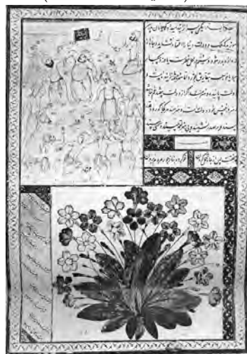
تصویر ۳- صوفی‌های در حال رقص گالری هنر فریر