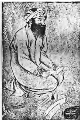
تصویر ۱۳- پرتره یک خوشنویس کتابخانه انگلستان، لندن