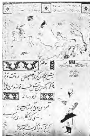
تصویر ۶- صحنه شکار توپکایی استانبول