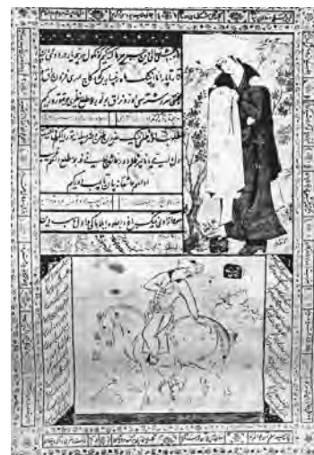
تصویر ۱۲- شکارچی بر پشت اسب موزه ویکتوریا و آلبرت لندن

شولتس ۱۱ ، تاریخ این تصویر را (۱۰۱۴ هـ.ق - ۱۶۰۵ م) می‌داند. اما سچوکین با نظر او موافق نیست. از نظر او تاریخ صحیح (۱۱۰۴ هـ.ق - ۱۶۹۲/۳ م) می‌باشد. م.ل. سوتیوچوفسکی ۱۲ و س. بابائی که این تصویر را در سال ۱۹۸۹ منتشر کردند، می‌نویسد که، سبک محمد قاسم در آن زمان از سبک خلاق رضا عباسی گرفته شده و در مورد تاریخ اینگونه ذکر کرده‌اند: "چنانچه عدد دیگری اضافه نشود معادل (۳-۱۶۹۲ م) اواخر عمر کاری این هنرمند" (سوتیوچوفسکی، بابائی، ۱۹۸۹، ۴۶۶) و مبنای آنها در این تاریخ گذاری نگاره موزه لوور می‌باشد که نشان می‌دهد شاه پیشخدمت جوانی را که به او شراب می‌داده را بغل کرده است و کلمات نوشته شده روی نگاره با این اطلاعات پایان می‌یابند که، این اثر در تاریخ جمعه ۲۴ جمادی‌الثانی (۱۳۰۶ هـ.ق - ۱۰ فوریه ۱۶۲۷ م) توسط محمد قاسم بیچاره خلق شده است. ۱۳