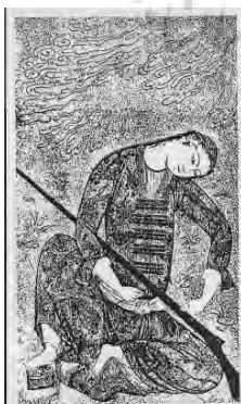
تصویر ۱۷- جوان بازنشسته با یک تفنگ زارتوریسکی، کراکو