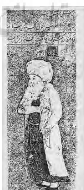
تصویر ۱۶- یک مقام عالی رتبه مذهبی