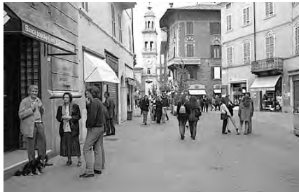
تصویر شماره ۱: رویکرد دوباره دنیا به سوی شهرهای پیاده

اجرای فضاهای عمومی به خصوص خیابان به عنوان یکی از عناصر اصلی فضای شهری از دید صاحب نظران، استفاده کنندگان و سرویس دهندگان در طول تاریخ، کاربرد و عملکرد خیابان به عنوان یک فضای عمومی، حرکت و جایگاه عابر پیاده در نظام حمل و نقل کنونی، دیدگاه‌های مختلف اثرگذار در طراحی شهری در زمینه جابجایی، شناخت و دسته بندی پارامترهای موثر بر حرکت عابر پیاده بر اساس اسناد طرح‌های جامع پیاده در ۱۴ شهر آمریکا و اروپا پرداخته و سپس با مقایسه اهداف، نیازها و ضوابط مشترک در شهرهای مورد مطالعه در جهت افزایش کیفیت فیزیکی محیط، با در نظر گرفتن معیارهای فرهنگی و اجتماعی- بومی به ارائه شاخص‌هایی در جهت ارزیابی موضوع میزان قابلیت پیاده‌مداری در محیط مورد مطالعه پرداخته خواهد شد.