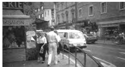
تصاویر ۶ و ۷: ایجاد تعادل بین ماشین و عابر پیاده