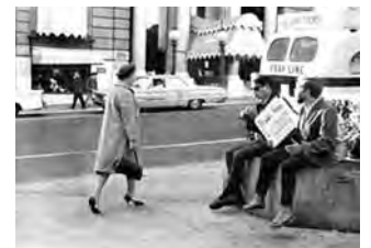
تصاویر شماره ۴ و ۵: تفاوت‌های استفاده از خیابان در جوامع شهری