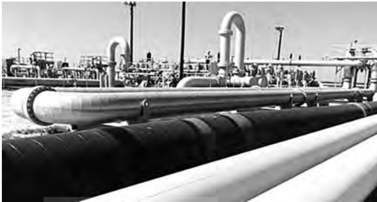
پول فروش نفت، درآمد دولت نیست، سرمایه ملت است.

مؤسسات دولتی به عهده گرفته‌اند، در بیشتر موارد براساس تضمین سازمان مدیریت و برنامه‌ریزی کشور یا گهگاه جهت رفع نیازهای کوتاه مدت دستگاه‌های مزبور قرار گرفته است. برخی از این وجوه جنبه تنخواه‌گردان داشته و باید پس از اجرای برنامه تنظیمی به بانک بازگردد، ولی بعضا با عدم پرداخت به موقع این اعتبارات، در زمره دیون دولت شمرده می‌شود. برخی از این تسهیلات نیز بر مبنای تکالیف تبصره‌های بودجه‌ای پرداخت شده است.