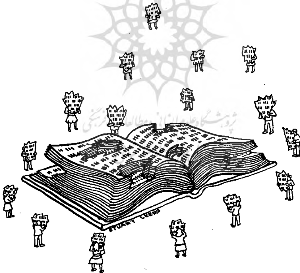
استوارت لیدز STUART LEEDS