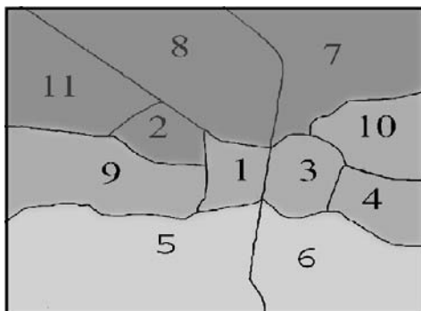
شکل شماره ۲: مناطق شهرداری اصفهان