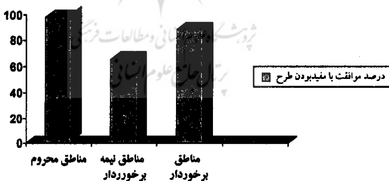
نمودار ۱. درصد موافقت سوادآموزان با مفید بودن طرح در مناطق مختلف استان

همان‌طور که مشاهده می‌کنیم، بیشترین رضایت از طرح را مناطق محروم دارند و پس از آن مناطق برخوردار و در آخرین رتبه مناطق نیمه‌برخوردار قرار می‌گیرند.