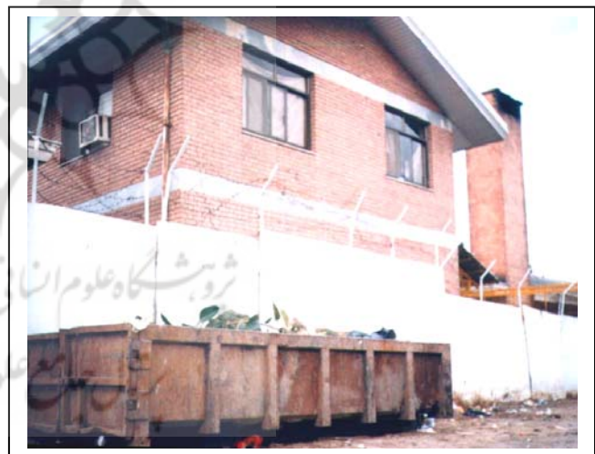
شکل‌های شماره (۱-۲): زباله تولیدی و آمیختگی با محل زیست انسانی

تولیدی، ۹۸٪ زباله خانگی، ۱٪ زباله صنعتی، ۱٪ زباله بیمارستانی در مراکز بهداشتی و درمانی است.