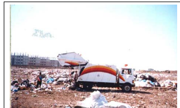
شکل‌های شماره (۵-۶): تجهیزات جمع‌آوری زباله‌های شهری و انتقال به محل دفن زباله