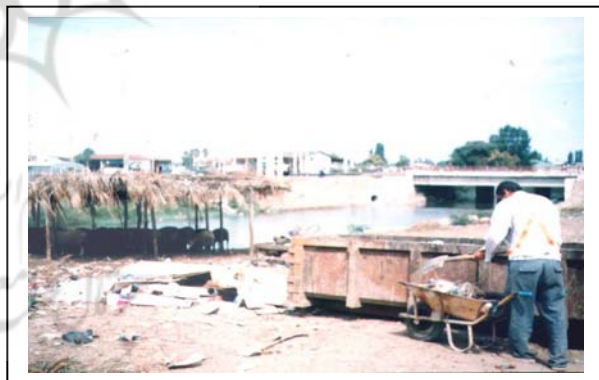
شکل‌های شماره (۳-۴): نحوه جمع‌آوری زباله‌های شهری و مکان‌گزینی آن در فضاهای با ارزش شهری