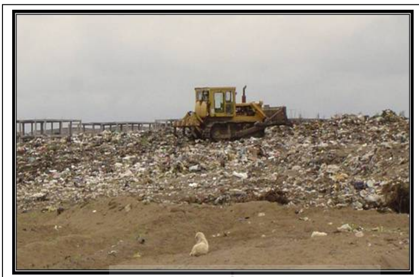
شکل شماره (۷): محل دفن زباله های شهری بابلسر در منطقه پارکینگ هشتم