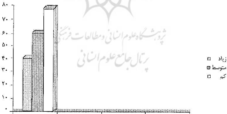
نمودار ۴: فعالیت جسمانی دختران در منطقه فوتبال (فراوانی)