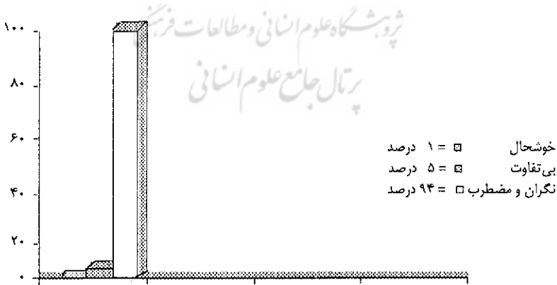
نمودار ۲: احساسات دختران درباره بلوغ در منطقه فوتبال (به درصد)