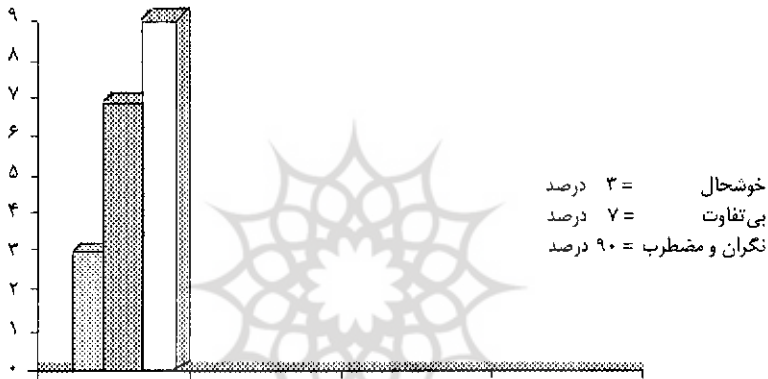
نمودار ۱: احساسات دختران درباره بلوغ در منطقه عباس آباد (درصد)

P < 0.5 و X^2 = 278/5 فوتبال و P < 0.5 و X^2 = 255/87 عباس آباد