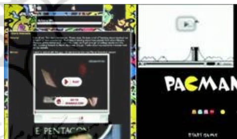
شکل ۳. تصاویر و سایر رسانه‌های گذاشته شده در یک شرح حال

سفارش طرح موضوع‌دار اغلب شامل استفاده از رسانه‌ها و طرح‌های گرافیکی می‌شود. این طرح‌ها با الگوهای همراه هستند که میزبان آنها، وب‌سایت‌های شخص ثالث می‌باشند که به عنوان محصول فرعی از آن طرح استفاده می‌کنند. با این حال، اعضا می‌توانند با چسباندن کدهایی که با تصاویر، ویدئو، صدا و حتی بازی‌ها پیوند دارند، آشکارا رسانه‌های گروهی را در صفحات خود بگنجانند (شکل ۳). این استفاده‌ی مجدد از رسانه‌های گروهی، دلیل استفاده از رنگ، صدا و انیمیشن بر روی صفحه را بیان می‌کند و از این گذشته راهی را که عناصر در فضای افقی و عمودی نمایش داده می‌شوند، نشان می‌دهد. در پیوند دادن به رسانه‌های گروهی به این شیوه، چه به صورت آشکار از طریق طرح‌ها یا از طریق جایگزین کردن، اعضا بیشتر کنترل خود را بر روی آنچه در شرح حال‌های آنها پدیدار می‌شود و تغییری که در طی زمان در آنها ممکن است رخ دهد، از دست می‌دهند. زیرا رسانه‌های گروهی اغلب در کامپیوترهای میزبان شخص یا شرکت موجودند.