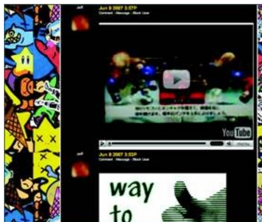
شکل ۴. توضیحات می تواند رسانه های گذاشته شده و همچنین پیامهای متنی را در بر گیرد.