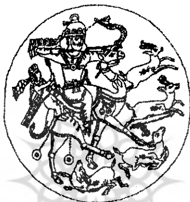
بهرام گور و سوگلی اش، آزاده، در حال شکار گوزن: سینی نقره ای طلاکاری شده سده پنجم یا ششم (Metropolitan Museum of Art, New York)

و فتنه‌انگیزی او نیز در صحنه شکار بهرام معلوم می‌شود. در روایت نظامی کنیز از بهرام درخواستی نمی‌کند و بهرام با شکار چند گور خر در یک لحظه و دوختن سم یکی به گوش وی، هنرمندی خود را در شکار معلوم می‌دارد. در سه روایت دیگر این هنرمندی به درخواست کنیز و به پیشنهاد وی انجام می‌گیرد.