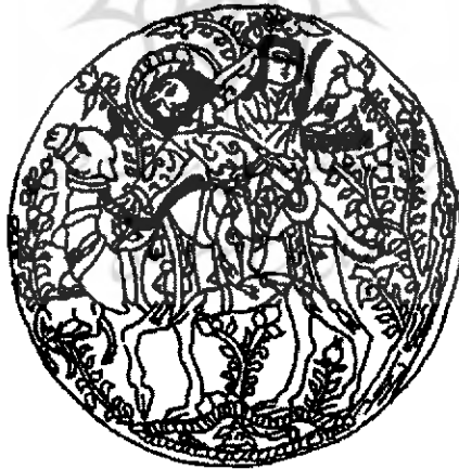
بهرام و سوگلی‌اش آزاده، در حال شکار: کاش سلجوقی از ری، نزدیک به سال ۱۲۰۰ (مجموعه صدرالدین آقاخان، ژنو.)

مایکل بری بر (بری بر، ۱۳۸۵: ۱۶۶) در کتاب خود تصویری از صحنه این شکار را می‌آورد که مربوط به کاشی از قرن ۱۲ میلادی است و درباره آن می‌نویسد: «هنگامی که نظامی منظومه خود را می‌سرود، از نزدیک شاهد اسلامی شدن این‌گونه چهره‌نگاری ساسانی بود در حالی که، سوگلی‌اش با نواختن ساز در وصف قهرمانی‌هایش می‌خواند، شاه سوار بر شتری با گردن خمیده، دستار به سر ولی همواره با هاله‌ای از فریا «روشنایی شکوه» شاهان ایران باستان، ساچمه‌ای گلی به سوی گوزنی پرتاب می‌کند تا گوشش را با پای پسین بخاراند، تا بتواند با یک تیر سم جانور را به سرش بدوزد.»