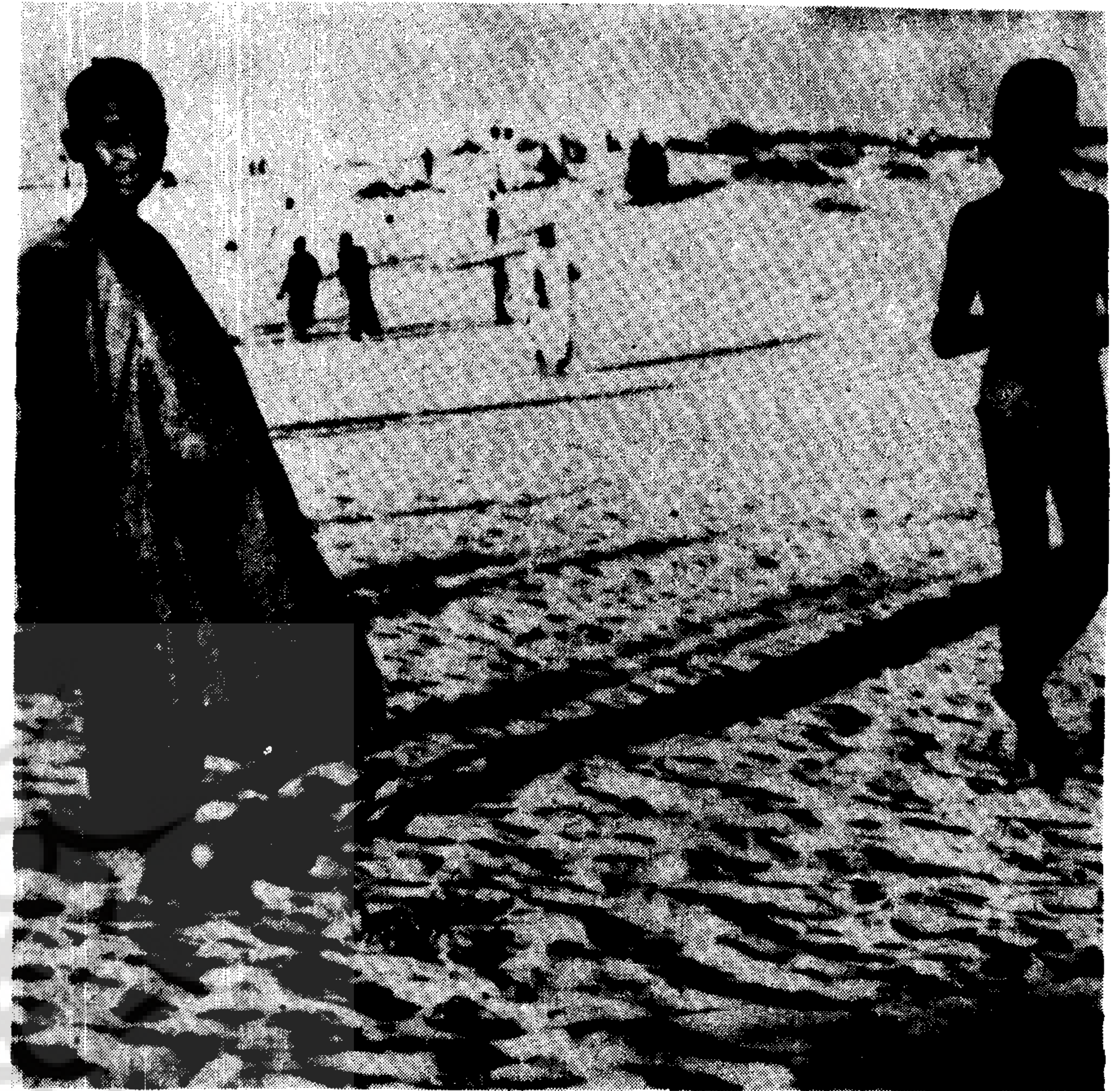
محیط گرم و خشک صحرائی در (Mali-Timbuctu) - شمال افریقا

تعمیر پیدامی کند و باعث خرج تراشی می شود. نمایان بودن بنا در مقابل طوفانهای گرد و خاک نیز سبب ریختگی و ضعف دوام ساختمان میگردد.