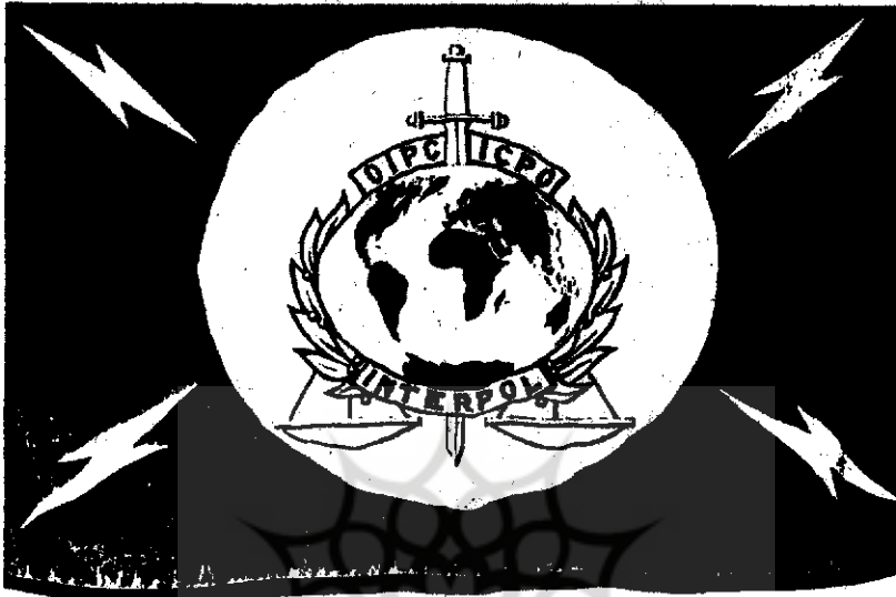
پرچم سازمان بین‌المللی پلیس جنایی