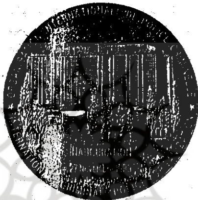
یادبود افتتاحیه ساختمان جدید در شهر لیون

بین‌المللی: انترپول تنها فعالیت نمی‌کند، بلکه در سطح بین‌المللی با سایر هیأت‌ها، سازمان‌ها، مقامات و مؤسسات بین‌المللی که برای مسائل خاص تشکیل شده‌اند