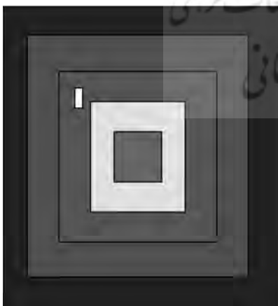
تصویر ۳ - تصویر کوچک شده نرم افزار شبیه سازی که آزمودنیها بر روی صفحه رایانه مشاهده میکردند.

جهت ایجاد حس شکست و همچنین ضبط دادههای مورد نظر، نرم افزار شبیه سازی خاص این پژوهش توسط مهندسين برنامه نویس ساخته شد. بر روی صفحه رایانه، آزمودنیها چندین مربع با اندازهها و رنگهای مختلف همانند تصویر شماره ۳ مشاهده می کردند. در روی این مربعها نقطه نورانی سفید رنگ متحرکی به زوایای مختلف صفحه رایانه حرکت میکرد. جهت کنترل نقطه نورانی توسط آزمودنیها دستگاه جویستیک به رایانه متصل بود. نقطه نورانی در مقابل اعمال آزمودنیها از خود واکنش در جهت گریز از کنترل نشان می داد. وظیفه آزمودنیها کشف قواعد رفتار و واکنشهای نقطه نورانی و تلاش برای کنترل آن در یکی از چهار محیط قرمز، زرد، سبز، آبی رنگی بود که از قبل بعنوان هدف انتخاب کرده بودند. تفاوت این چهار محیط علاوه بر