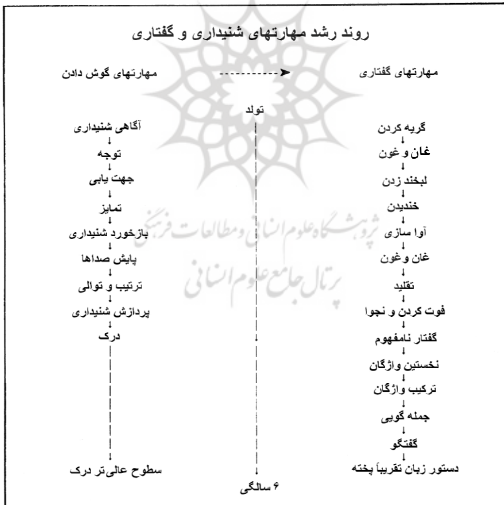
جدول ۱: طرح کلی مراحل رشد ارتباط شنیداری / کلامی

بیشتر برنامه‌های شنیداری / کلامی، جلسات درمانی هفتگی به مدت ۱ تا ۱/۵ ساعت را پیشنهاد می‌کنند، هرچند برخی برنامه‌های خصوصی و درمانگران مستقل جلسات درمانی بیشتری را تدارک می‌بینند. درمان بیشتر ممکن است سودمند باشد یا سودی نبخشد و وابسته به متغیرهای زیادی است. این والدین و مراقبان کودک هستند که نیاز دارند از هر