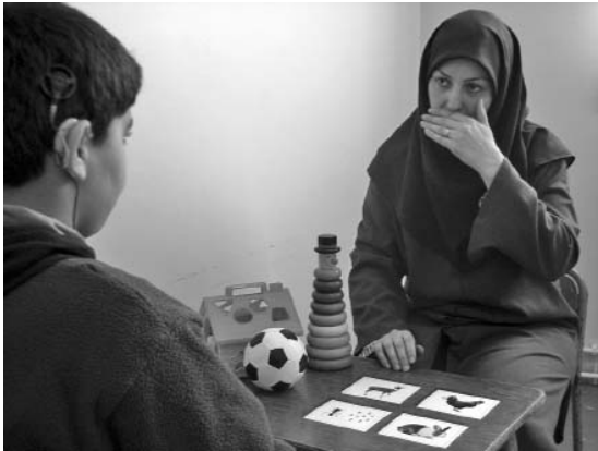
شکل ۲: پوشاندن دهان هنگام تربیت شنوایی کودکی با کاهش شنوایی شدید دارای سمعک.