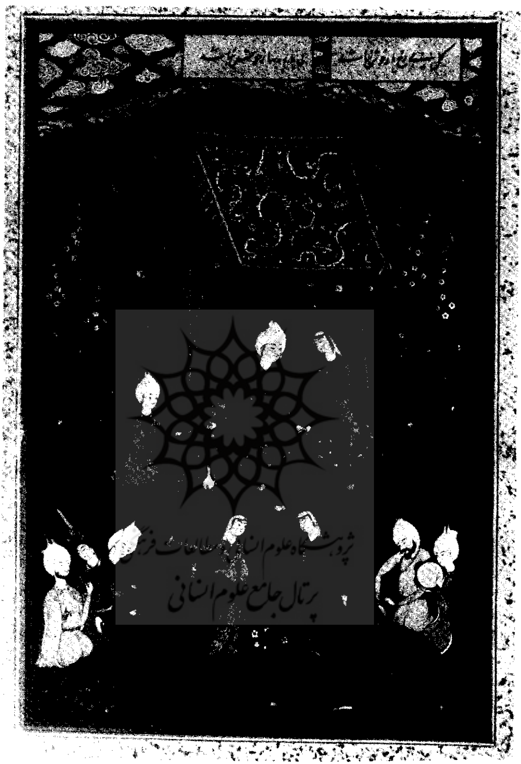
تصویر نقشی یک مجلس از دیوان حافظ کار سلطان محمد