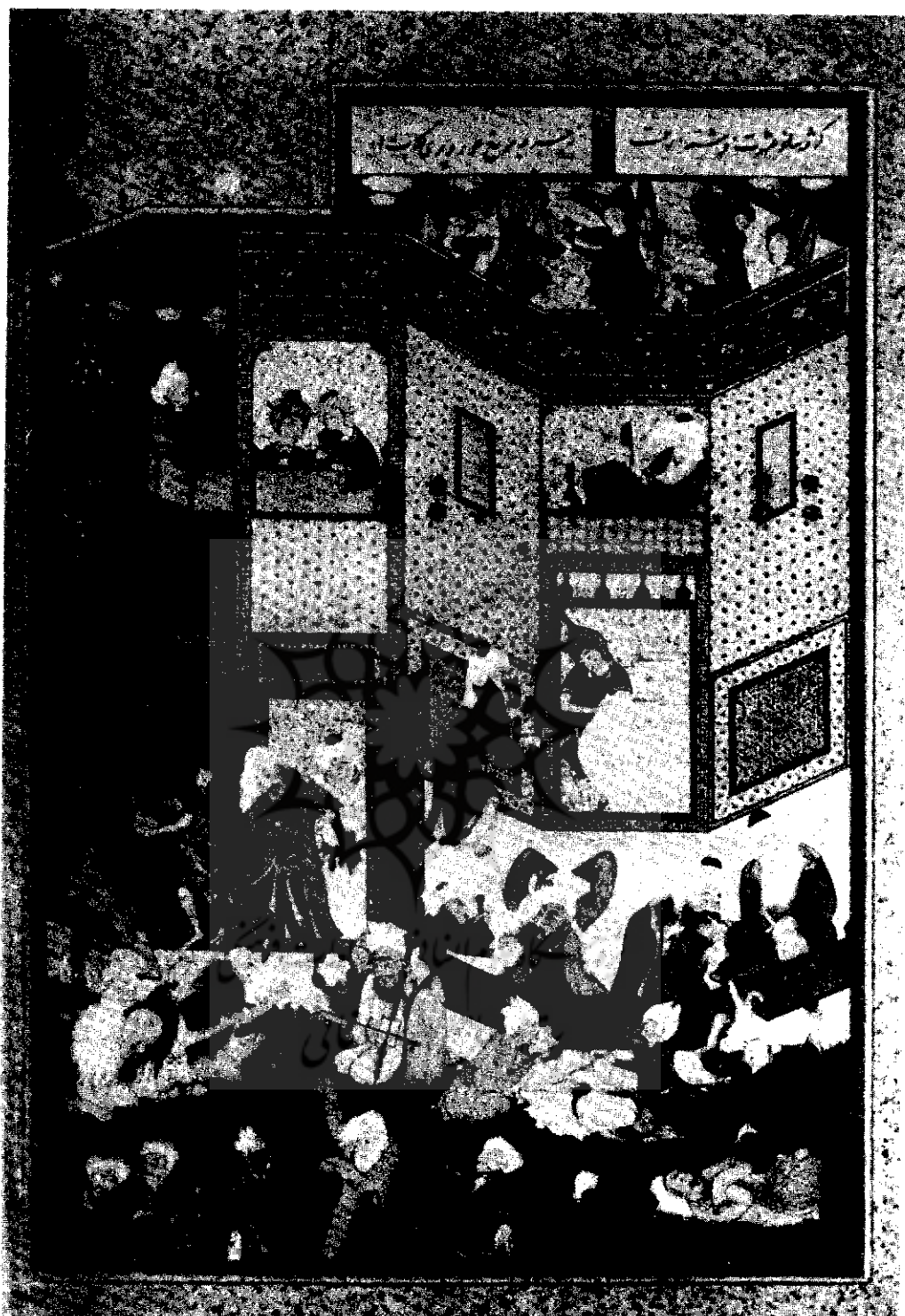
تصویر نقاشی یک مجلس از دیوان حافظ کار سلطان محمد