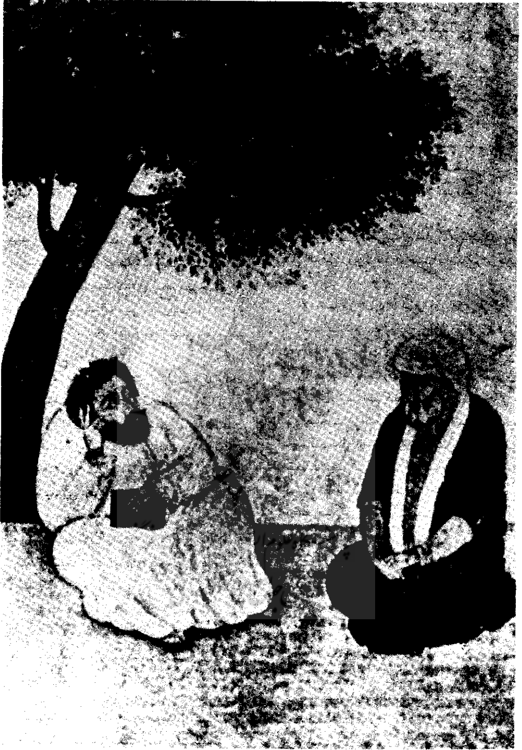
تصویر نقاشی حافظ و ابواسحاق اینجو