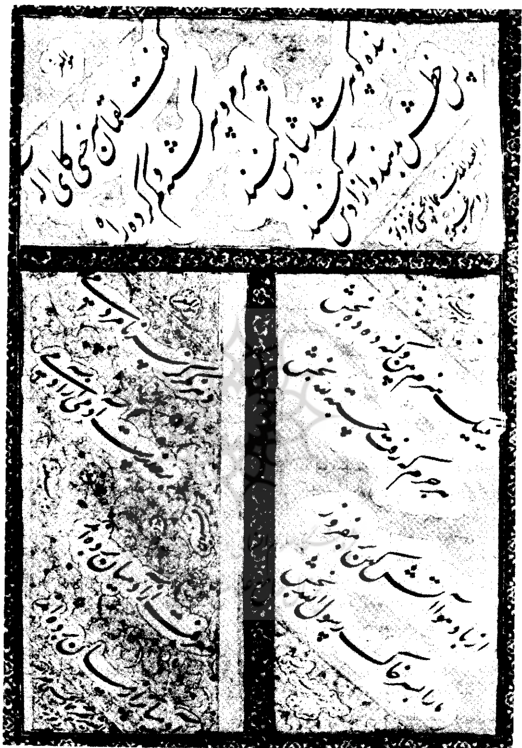
تصویر دو بیت از یک غزل حافظ بخط میرعماد.