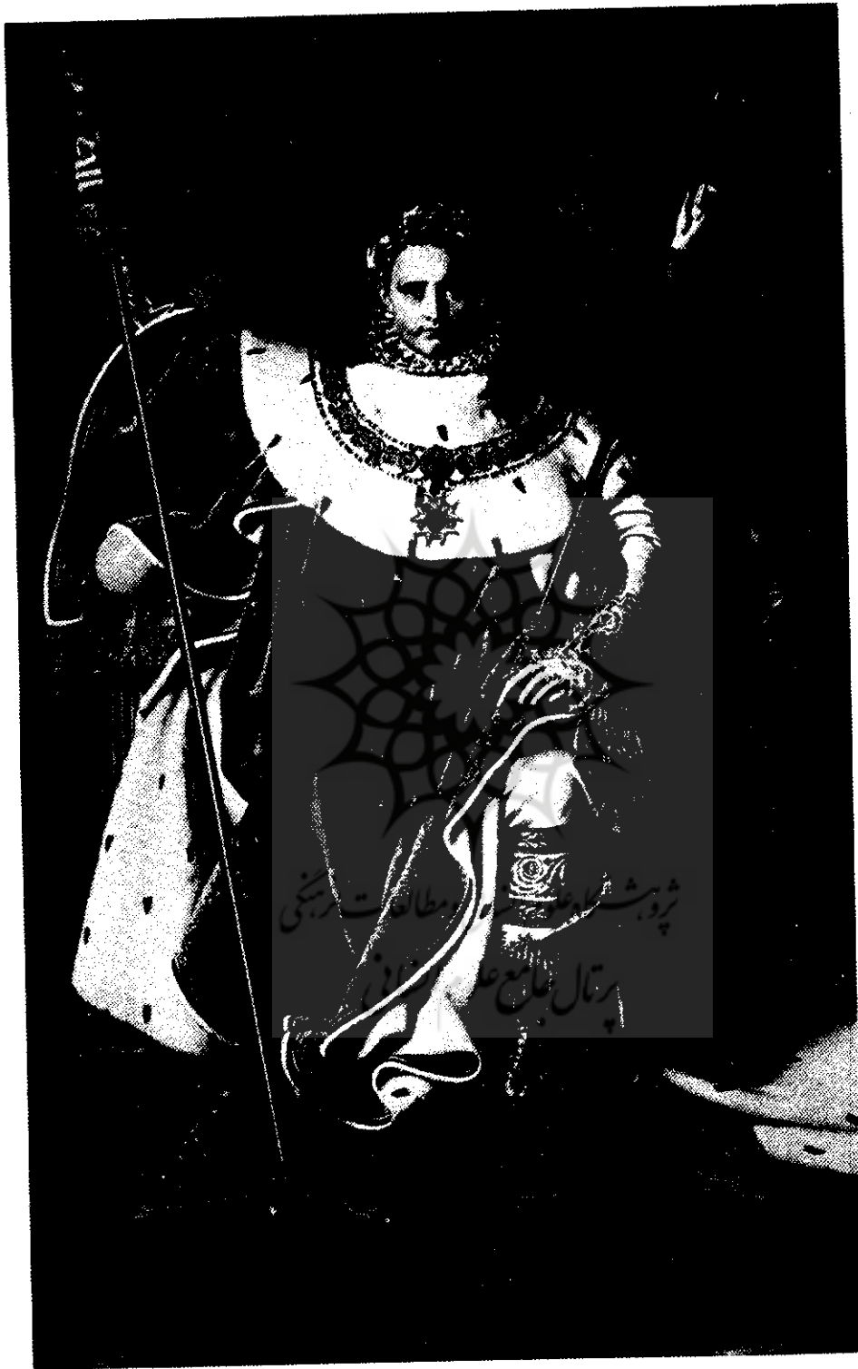
اینگر - تاپه یون اول