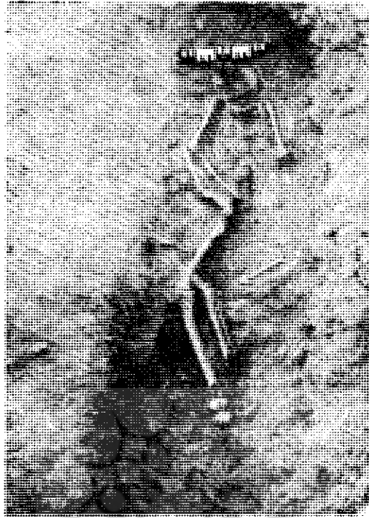
عکس شماری ۳ تپه جهودها - گور شماری ۳، پس از خاکبرداری وتمیز کردن