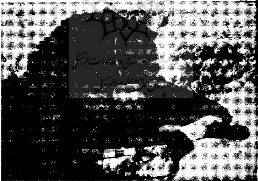
عكس شماره ۲ محوطه‌ی كوچك حدفاصل گورها در تپه جهودها. برای به امانت سپردن اشیاء یا جسد (?) پس از خاک برداری نهائی