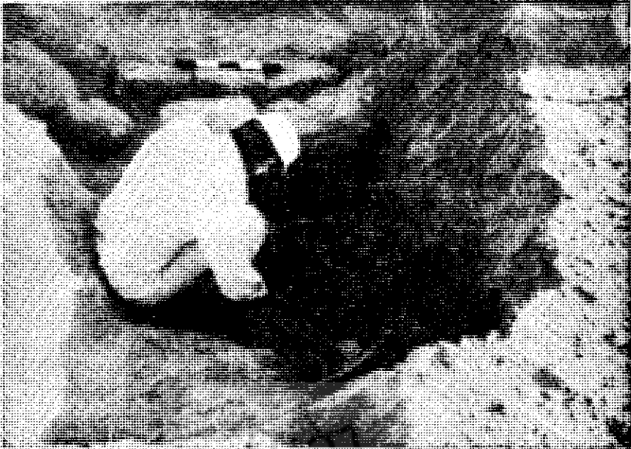
عكس شماره ۱ تپه جهودها- گور شماره ۲ هنگام خاک برداری و مشخص کردن چگونگی خاک سپاری