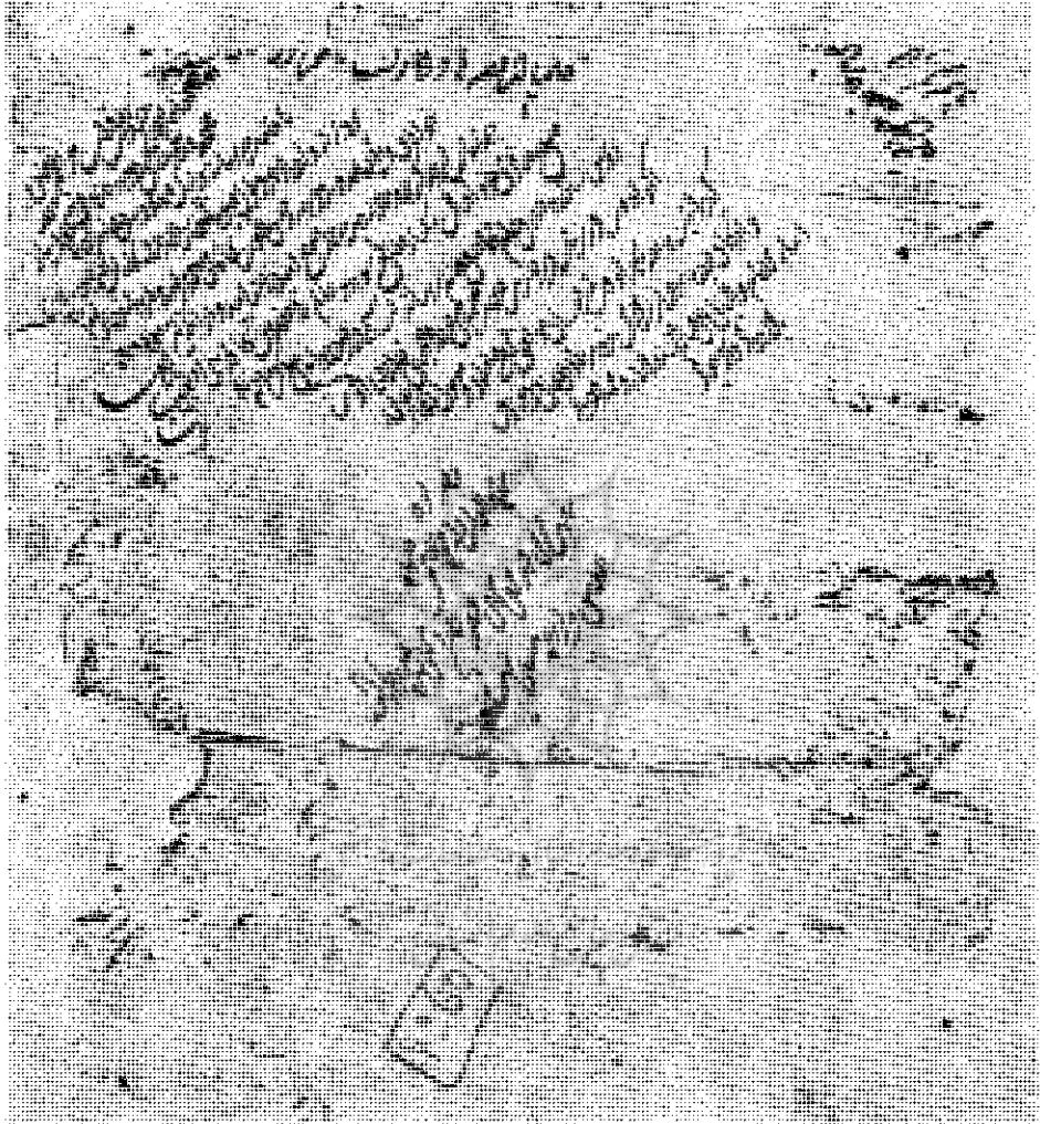
قسمت آخر - سند شماره ۲۷