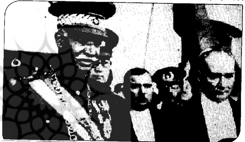
رضاخان و آتاتورک

در دهه ۱۹۷۰ ایران و ترکیه هر دو ذاتاً حکومت‌هایی مداخله‌گر در اقتصاد بودند، اما در حالی که ترکیه بر مازاد درآمد تولیدشده در داخل کشور متکی بود، حکومت ایران تقریباً همه درآمد خود را از منابع خارجی، یعنی عمدتاً نفت تأمین می‌کرد