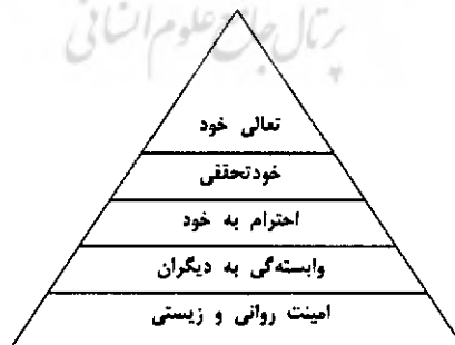
نمودار ۲- سلسله‌مراتب نیازهای انسان از دیدگاه مزلو (۱۹۷۰)

همچنان که پیشتر گفته‌شد، معنویت تنها به فعالیت‌های زیست‌شناختی و عصب‌شناختی مربوط نیست؛ بلکه معنویت به طور کلی برای انسان وجود دارد و یکی از والاترین نیازهای انسان است و نقشی بنیادی و محوری در سلسله‌مراتب نیازهای انسان بازی می‌کند. بدین سان، نگاه موجود به سلسله‌مراتب نیازهای انسان (نمودار ۲) به گونه‌ی دیگر در گفتار هوش معنوی مطرح می‌شود (نمودار ۳).