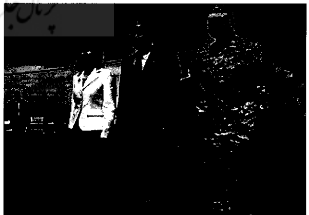
فورت سوس (Fort Suse)، سربازخانه قدیمی نظامیان عراقی در نزدیکی

کمپ بوکا، بزرگترین زندان آمریکاییان به مساحت ۴۰۰۰۰۰ متر مربع، در بیابانی نزدیک ام‌القصر، در جنوب کشور قرار دارد. بوکا اولین مکانی بود که نیروهای نظامی آمریکایی در آن زندانیان را هدف آزار و اذیت و شکنجه قرار می‌دادند. این امر در می ۲۰۰۳، درست دو ماه پس از اشغال عراق و در نخستین روزهای احداث این زندان، به وقوع پیوست. (۶۸) در آغاز، طراحان آمریکایی زندان را برای نگهداری ۲۰۰ تا ۲۵۰۰ زندانی طراحی کرده بودند. (۶۹) اما در مارس ۲۰۰۶، حدود ۸۵۰۰ زندانی در این زندان بازداشت بودند. (۷۰) عفو بین‌الملل در سال ۲۰۰۳ گزارش داد، زندانیان در کمپ بوکا «در چادرهایی همراه با گرمای شدید و بدون دسترسی به آب نوشیدنی یا تأسیسات شستشو نگهداری شده‌اند. آنها مجبورند برای دستشویی، گردال‌هایی حفر کنند و امکان تعویض لباس‌های خود را نیز ندارند، حتی اگر دو ماه از زندانشان گذشته باشد». (۷۱) در سال ۲۰۰۶، برخی از چادرها، جای خود را به کلبه‌هایی مسقف با شرایط بهداشتی بهتر دادند، اما این مجموعه وسیع در صحرای سوزان با خطر طوفان شن مواجه بوده و جالهای جهنمی برای زندانیان است. کل مجموعه، شامل ده اردوگاه بوده که هر یک از آنها، با سیم خاردار و برج‌های دیده‌بانی محافظت می‌شوند. در هر یک از این اردوگاه‌ها، ۸۰۰ زندانی حضور دارند. زندانیان چندین مرتبه نسبت به رفتار بد، شرایط وخیم و اهانت‌های مذهبی زندانبانان دست به شورش زده‌اند. در ژانویه ۲۰۰۵، زندانبانان از برج‌های دیده‌بانی به روی شورشیان آتش گشودند که در نتیجه آن، ۴ زندانی کشته و ۶ نفر زخمی شدند. (۷۲)