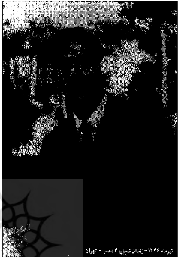
تیرماه ۱۳۴۶ - زندان شماره ۴ قصر - تهران