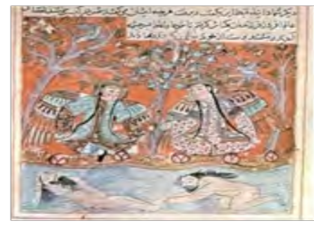
تصویر ۱۱- پادشاهی اردشیر (بهمن)، بر دار کردن فرامرز. کتاب معرفی نسخه‌های شاهنامه فردوسی ص ۹