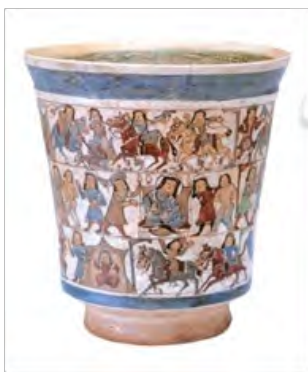
تصویر ۷- داستان بیژن و منیژه، قرن چهارم هـ. ق، کتاب مروری بر نگارگری ایرانی ص ۴۷

در گالری «هنر فریر» در واشنگتن بشقاب بزرگ قرار دارد، که صحنه حمله به یک دژ را نشان می‌دهد و اسامی مهاجمان به وضوح نوشته شده است. بی‌تردید این صحنه بازنمایی رویدادی است که تا کنون شناسایی نشده است.