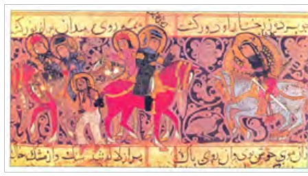
تصویر ۱۲- یک مجلس از نگاره‌های ورقه و گلشاه (عبدالملک ابن محمد الخوئی) کتاب نگاهی به هنر نقاشی ایران ص ۶۴