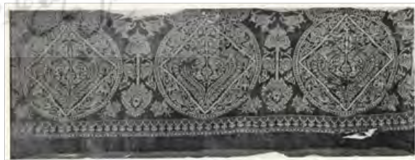
تصویر ۲- پارچه ابریشم و پشم، بنفش و زرد، مجموعه آقا و خانم ادوارد جکسن هلمس، کتاب شاهکارهای هنر ایران ص ۱۳۴

نقوش روی سفال‌ها و کاشی‌ها نشان دهنده گرایش‌های عمده هنرمندان این عصر بر مضامین اسطوره‌ای در شاهنامه است. سفالگران دوره سلجوقی سفال‌هایی با لعاب یک رنگ، بدون لعاب، زرین فام، مینایی، نقاشی زیر لعاب و مشبک را با مهارت کامل انجام می‌دادند. از این دوره پیکره‌های مختلف انسان‌ها، مجسمه‌هایی از حیوانات و پرندگان به دست آمده است.