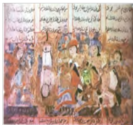
تصویر ۱۳- شموط و شماط با پریان. سمک عیار، کتاب آشنایی با رنگ آمیزی در آثار هنری ایرانیان ص ۷۳

در نگاره کشتی گرفتن بهرام گور حدود ۱۰ صورت وجود دارد که تمام ترکیب‌بندی را با صورت‌های آدم‌ها و هیکل آن‌ها پر شده و هیچ چیز دیگری در تصویر وجود ندارد. شنگل نشسته بر تخت و اشخاص در اطراف او قرار گرفته‌اند و در جلو بهرام در حال کشتی گرفتن است. ترکیب بندی در این کار ساده و ابتدایی است.