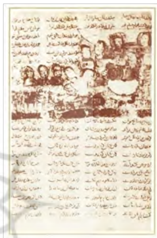
تصویر ۱۹- کشتی گرفتن بهرام گور در بارگاه سنگل و هنر نمودن. کتاب معرفی نسخه‌های شاهنامه فردوسی ص ۱۷