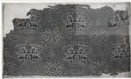
تصویر ۱- پارچه ابریشم و پشم، سفید و سرمه ای ۵۳ × ۳۰ سانتی‌متر مجموعه مور در دانشگاه بیل کتاب شاهکارهای هنر ایران ص ۱۳۳

با آن که کتاب‌های مصوری چند از این عصر به جای مانده و نیز چند نقاشی دیواری اما برای شناخت هنر نقاشی ایرانی عصر سلجوقی بهترین اسناد موجود کاشی‌ها و سفال‌های لعابدار منقوش این دوران می‌باشد. سفال‌گران دوره سلجوقی تکنیک جلادادن ظروف سفالی را که در دوره عباسی شایع بود احیا کردند رنگ ظروف جلادار ایران در دوره سلجوقی متنوع است و از سبز طلایی کمرنگ تا قهوه‌ای تیره روی لعاب سفید دیده می‌شود گاهی رنگ آبی یا فیروزه‌ای نیز بکار رفته و این رنگ در چند بشقاب و ابریق که در موزه متروپولین است یافت می‌شود. (دیامند، ۱۳۳۶: ۱۷۷ و ۱۷۸).