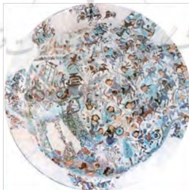
تصویر ۶- تسخیر یک قلعه، قرن هفتم هـ. ق. گالری هنر فریر. کتاب مروری بر نگارگری ایرانی ص ۴۶