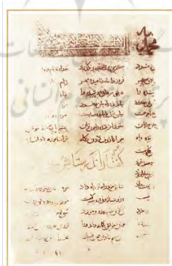
تصویر ۹- آغاز کتاب، گفتار اندر ستایش خرد، نسخه کاما، کتاب معرفی نسخه‌های شاهنامه فردوسی ص ۱۵