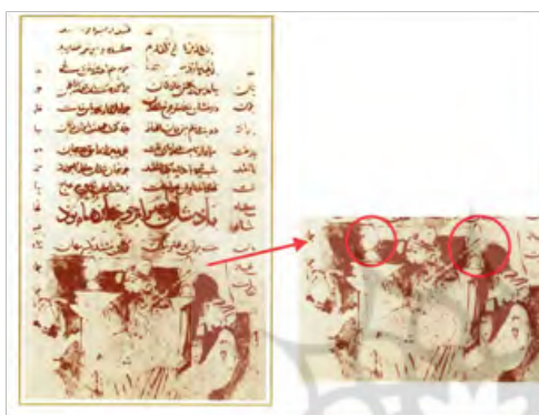
تصویر ۲۰- بر تخت نشستن بهرام چوبینه. کتاب معرفی نسخه‌های شاهنامه فردوسی ص ۱۹

لباس‌ها هم بر روی آن‌ها هنوز به ترکیب‌بندی‌هایی با جزئیات فراوان‌تر در اشکال و تنوع بیشتر در رنگ‌ها نرسیده است. در حالی که صورت‌های نژاد زرد با هاله‌های طلایی پشت سر آن‌ها دیده می‌شود (که شاید تأثیر از هنر بیزانسی هم بتوان تلقی کرد). که البته گفته می‌شود که هنر بیزانس هم متأثر از نقاشی‌های مانوی است. در مکتب سلجوقی، نقش‌ها و تزئینات بر روی متن رنگ آمیزی شده پدیدار گشته‌اند. بدین صورت که ابتدا صفحه اصلی را رنگ آمیزی و سپس نقوش و نگاره‌ها را رنگ آمیزی می‌کردند، این رنگ معمولاً سرخ بوده است که زمینه را با آن می‌پوشاندند. در نسخه‌های خطی، این نقاشی‌ها مستقیماً بر روی صفحه کتاب انجام می‌گرفت و از چین و چروک در لباس‌ها به شیوه‌های نقاشی مسیحی، رایج در مکتب عباسی خبری نیست و لباس‌ها را با گل و گیاه و نقوشی به سبک اسلیمی تزئین می‌کردند. (شریف زاده، ۱۳۷۵: ۷۸) مرحوم غروی در مقاله پژوهشی در شاهنامه (۳) در ذیل تصویر اشاره می‌کند: «رسم الخط بسیار کهن کتاب می‌توان به قدمت آن پی‌برد. این کتاب به احتمال قریب به یقین کهنسال‌ترین شاهنامه مصور جهان است با ۴۵ تصویر. خط آن با خط نسخه کهن التفهیم بیرونی، از قرن پنجم، متعلق به همین کتابخانه قابل قیاس است.» (غروی، ۱۳۵۲، ۵۳)