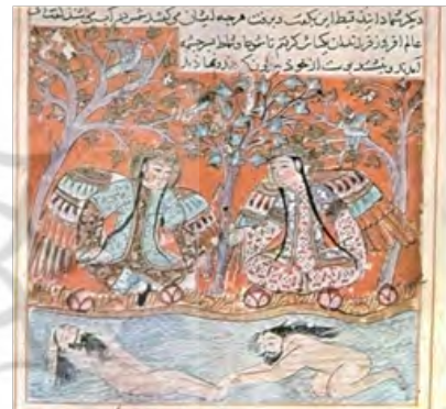
تصویر ۳- شموط و شماط با پریان، سمک عیار، کتاب آشنایی با رنگ آمیزی در آثار هنری ایرانیان ص ۷۳

تا سده چهارم هجری قمری انواع گوناگونی از کاغذ پدید آمده بود که دائماً تنوع آن‌ها رو به فزونی می‌رفت. گران‌ترین نوع آن‌ها، کاغذ نسبتاً ضخیمی بود که « زرافشان » می‌کردند. (بازل گری، ۱۳۵۴ : ۳۳)