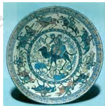
تصویر ۵- بهرام گور و آزاده، ری سده هفتم هـ. ق، کتاب آثار ایران در موزه متروپولیتن ص ۳۹

در همان موزه ظرفی کوچک ولی معروف وجود دارد که با تصاویر صحنه‌هایی مجزا که در سه ردیف مرتب شده بدون شرح که داستان بیژن و منیژه، یک زوج دیگر از شاهنامه را نشان می‌دهد.