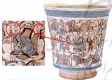
تصویر ۲۱- داستان بیژن و منیژه، قرن چهارم هـ. ق. کتاب مروری بر نگارگری ایرانی ص ۴۷