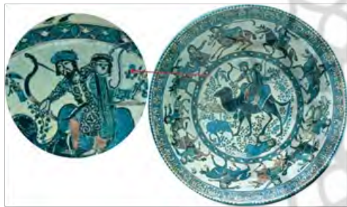
تصویر ۱۸- بهرام گور و آزاده، ری سده هفتم ه. ق. کتاب آثار ایران در موزه متروپولیتن ص ۳۹