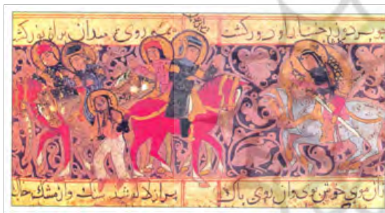
تصویر ۴- یک مجلس از نگاره‌های ورقه و گلشاه (عبدالملک ابن محمد الخوئی) کتاب نگاهی به هنر نقاشی ایران ص ۶۴

این نسخه ممتاز طبق تحقیقات بعمل آمده در اواخر قرن ۴ و اوایل قرن ۵ هجری نگاشته و مصور شده است. متن تعداد زیادی از هفتاد و یک مینیا توره این کتاب به رنگ‌های قرمز و آبی و سبز رنگ آمیزی شده. بخش ساده متن با گل‌ها و پرندگان و انواع پیچک‌های تزئینی آرایش شده است. از نظر شیوه نقاشی تصاویر این کتاب بلافاصله نقوش سفال‌های لعابدار همان دوران را بخاطر می‌آورد متن کتاب به شعر فارسی است و نقاشی‌های آن در نهایت زیبایی و ظرافت. هنرمند همه جا به رسالت خویش دایره به اجتناب از بکار بردن سایه و روش و پرسپکتیو تصنعی و مراعات کیفیت دو بعدی اثر خویش وفادار مانده است. رنگ‌ها بر طبق اصول توازن در سطح بر بنیاد نقاشی‌های دیواری ایران باستان در کنار هم گذاشته شده و کیفیت پسی و پیشی افراد و اشیاء نه به وسیله فن مرآیای غربی بلکه بر اساس تنظیم سطوح بر روی هم نمایانده شده است. (همان، ۶۴ و ۶۵)