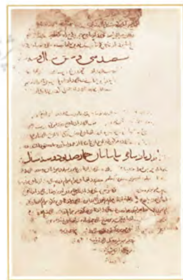
تصویر ۸- پادشاهی ساسانیان، نسخه کاما، کتاب معرفی نسخه‌های شاهنامه فردوسی ص چهارده